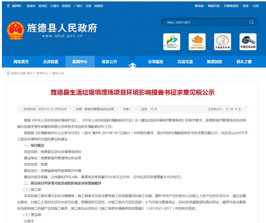
图 3.2-1 征求意见稿公示网络截图