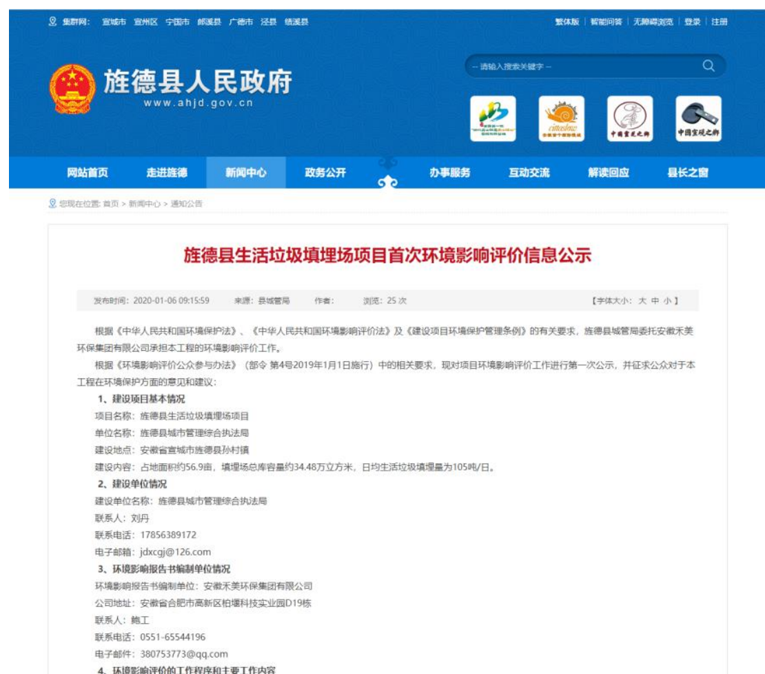
图 2.2-1 第一次公示网络截图