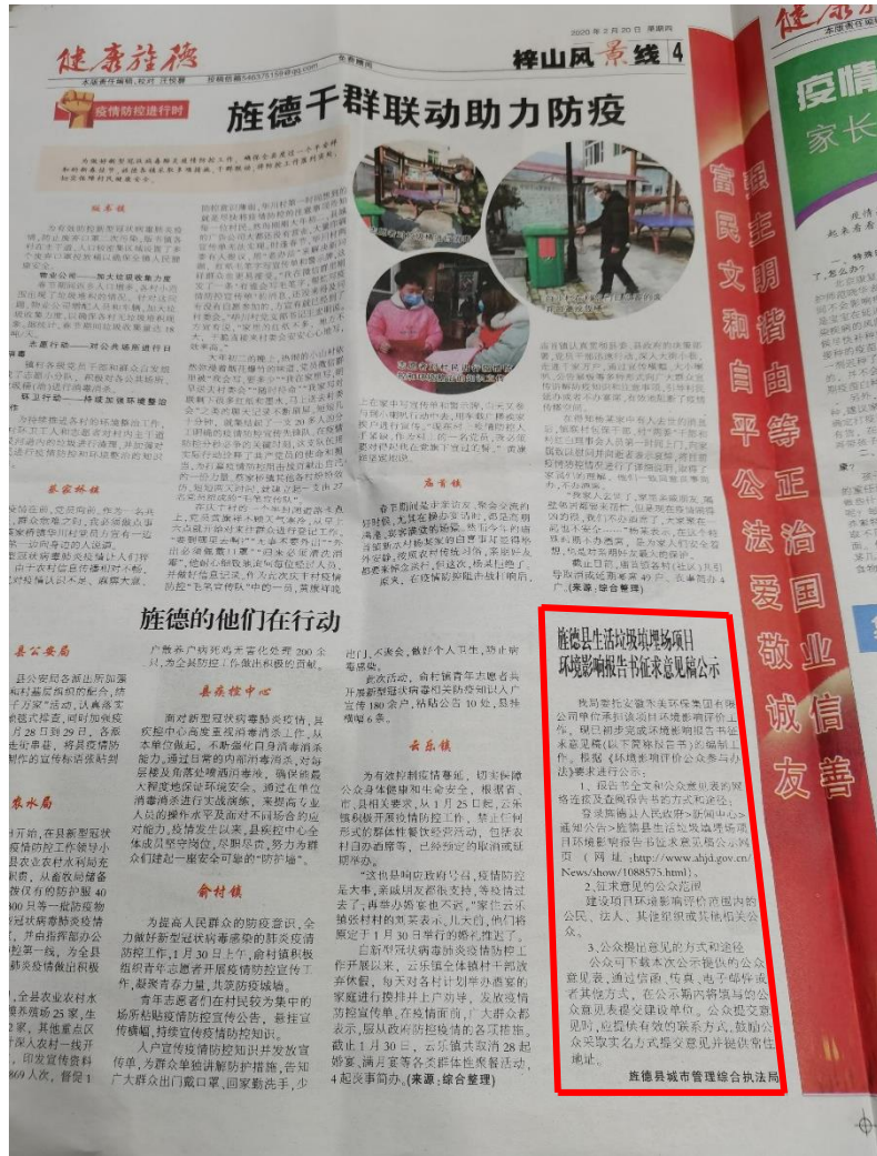
图 3.2-4 报纸公示截图