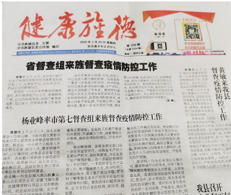
图 3.2-3 报纸公示截图