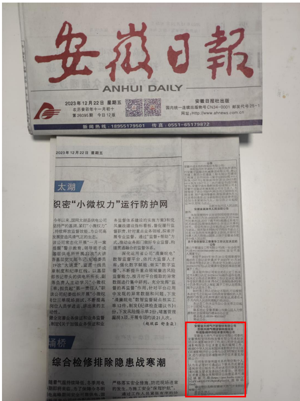
图 3-3 征求意见稿报纸公示第二次截图