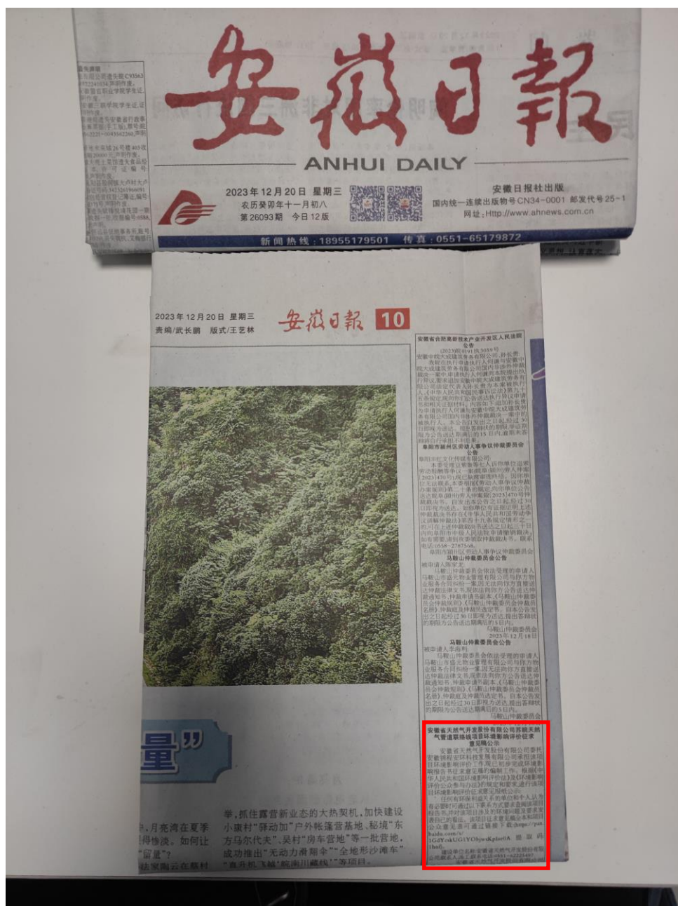
图 3-2 征求意见稿报纸公示第一次截图

本项目分别于2023年12月20日和2023年12月22日在安徽日报发布了“苏皖天然气管道联络线项目环境影响报告书（征求意见稿）”公示，安徽日报属于项目所在地公众易于接触的报纸，公示载体符合要求，在公示时间10个工作日内公示两次，公示时间符合要求。征求意见稿报纸截图见下图。