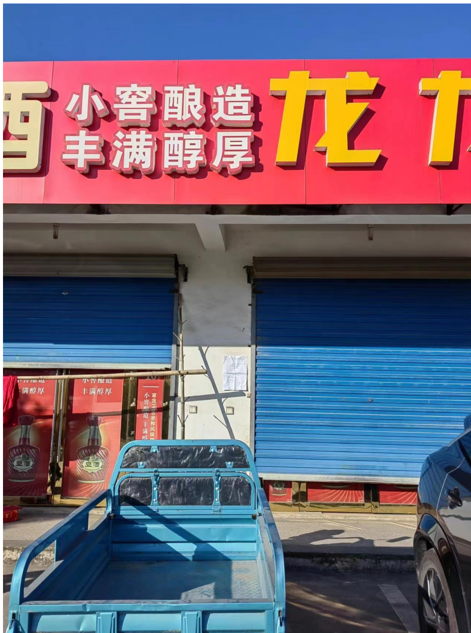
图 3-4 现场张贴公示

本项目于 2023 年 12 月 18 日，在项目所在地周边东久村敏感点处张贴了“苏皖天然气管道联络线项目环境影响报告书（征求意见稿）”公示。征求意见稿现场张贴照片见下图。