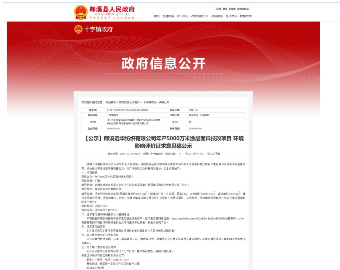
图 3-2-1 征求意见稿公示网站截图