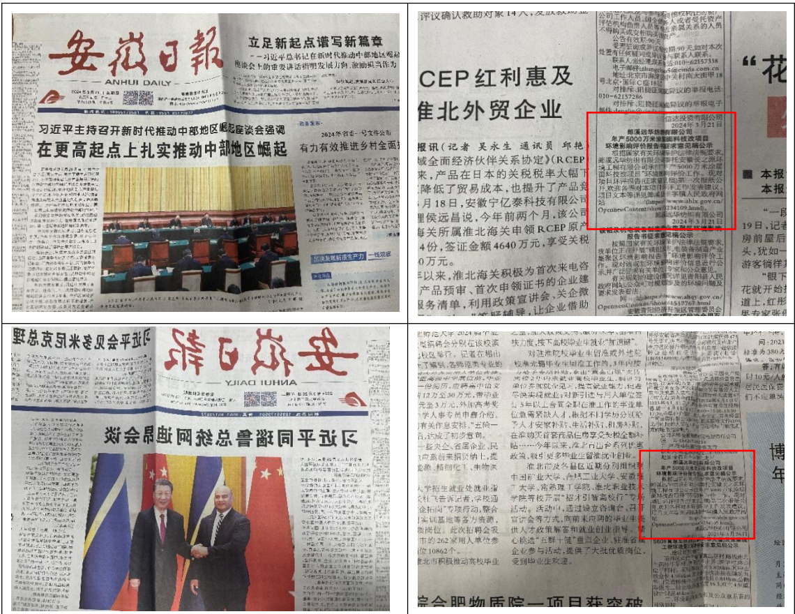
图 3-2-2 报纸公示网站截图

2024年3月21日至2024年3月26日，我公司在《安徽日报》进行了2次报纸公示，具体公示情况见下图。