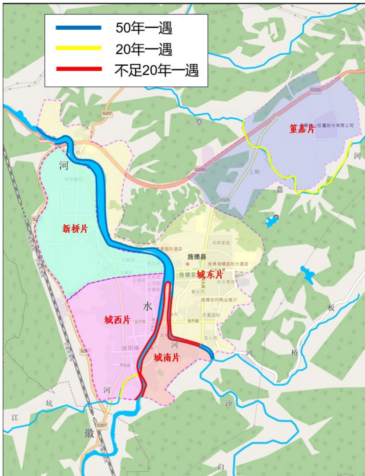
图 3.3.2-1 旌德县中心城区现状防洪体系示意图