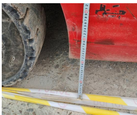
图十叉车底盘高度