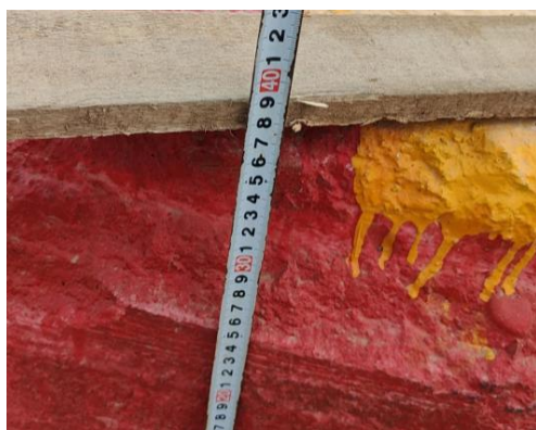
图九引道高度最高点