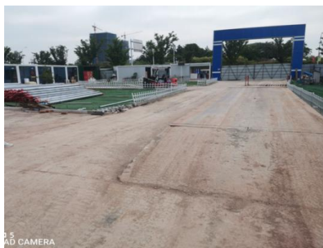
图五现场地磅安装处