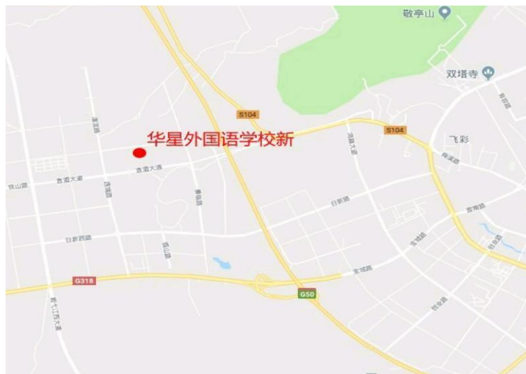
图一事故项目地理位置图

宣城市华星外国语学校重建选址项目建设地点宣酒大道以北、铜山路以西、秋实路以南。该项目共计建设 2 栋建筑, 分别为: 9#学生宿舍、11#教师公寓。项目区域地理位置图 (见图一), 项目规划图 (见图二)。