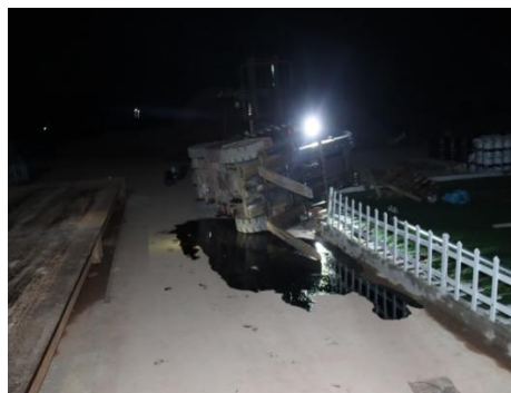
图六叉车侧翻位置图