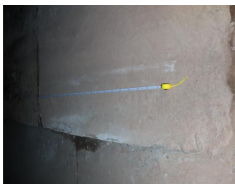
图七引道及边缘擦痕