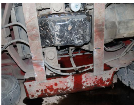
图八叉车底盘擦痕