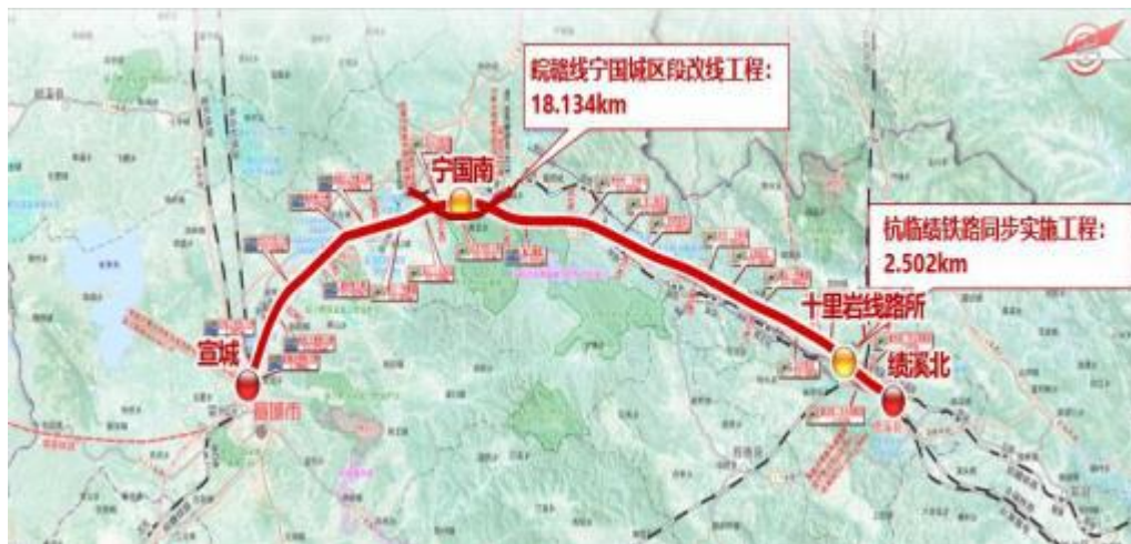
图1-1宣城至绩溪高速铁路范围图