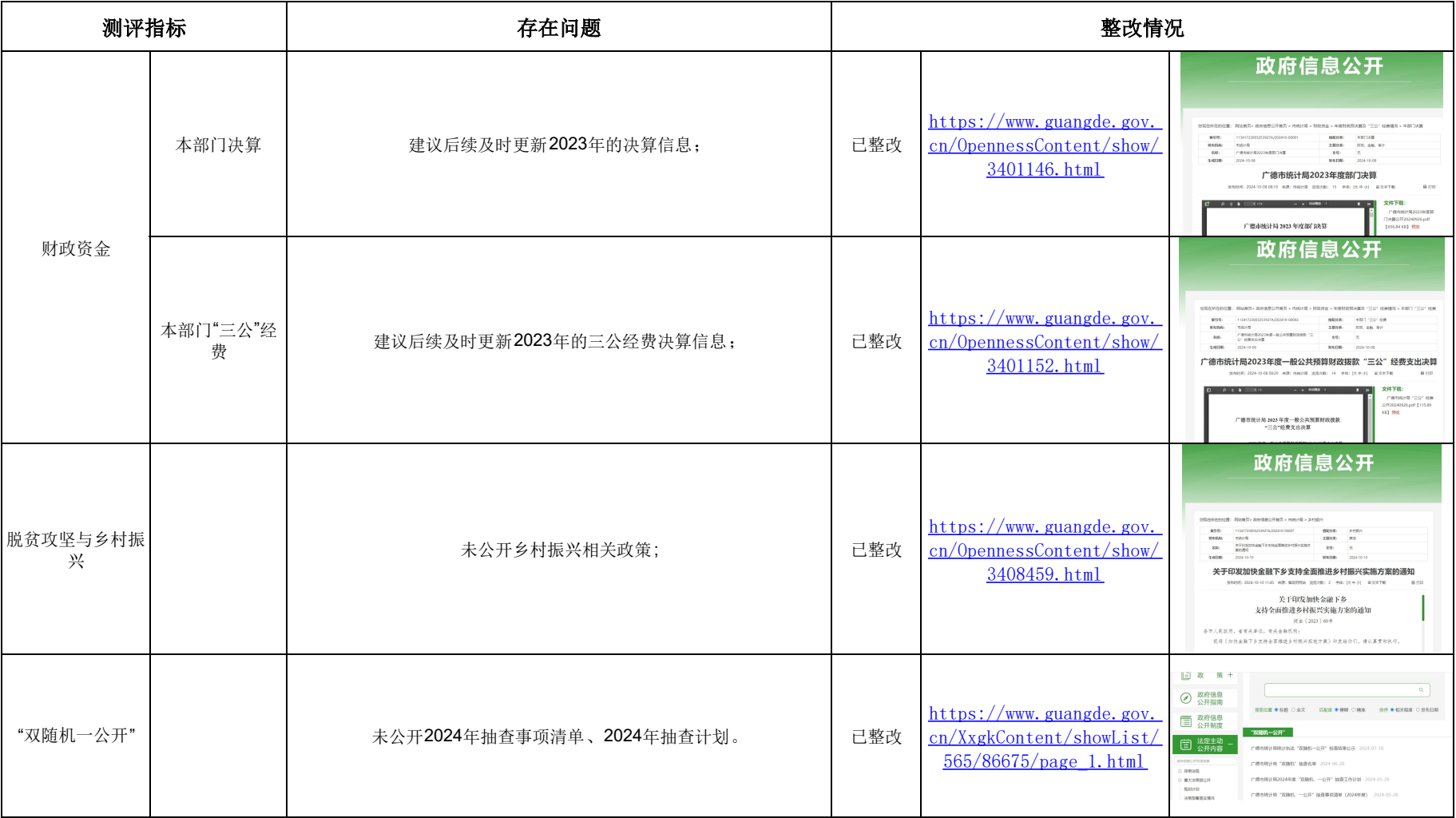
广德市统计局信息发布测评问题清单整改情况