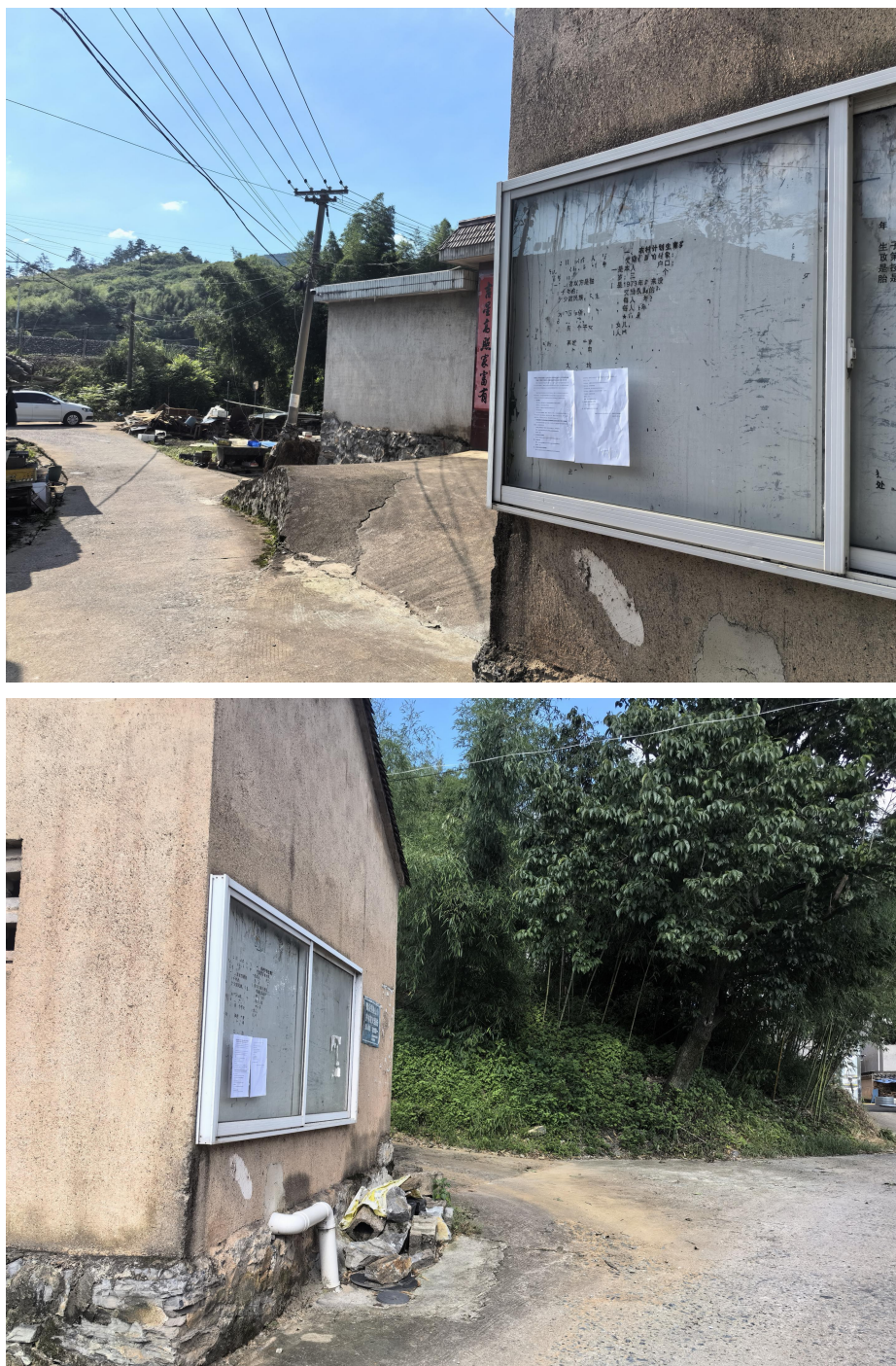
图 3-4 张贴公告情况

2024 年 6 月 18 日到 2024 年 7 月 1 日在项目地周边敏感点搭掌坞公告栏门口进行了张贴公示，张贴公告处为项目所在地公众易于知悉的场所，张贴区域符合《环境影响评价公众参与办法》的要求。