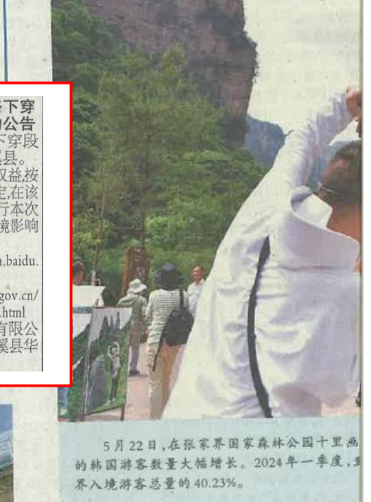
5月22日,在张家界国家森林公园十里画的韩国游客数量大幅增长。2024年一季度,入境游客总量的40.23%。

一次次握手,传递着党中央的深切关怀。一声声嘱托,感召自立自强的奋进力量。人民大会堂,又一次见证新时代的荣光。 24日上午,全国科技大会、国家科