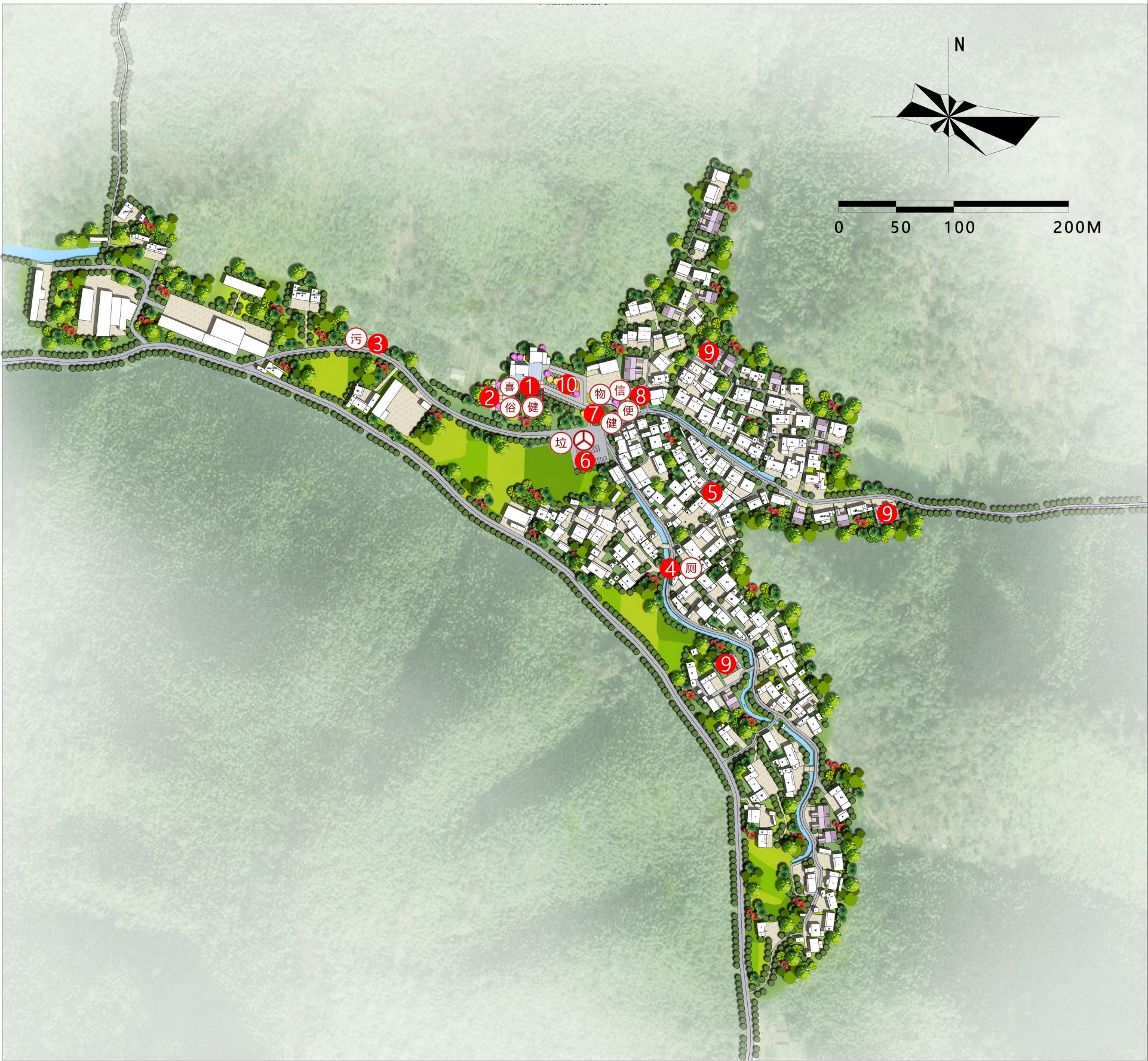
重点区域总平面图