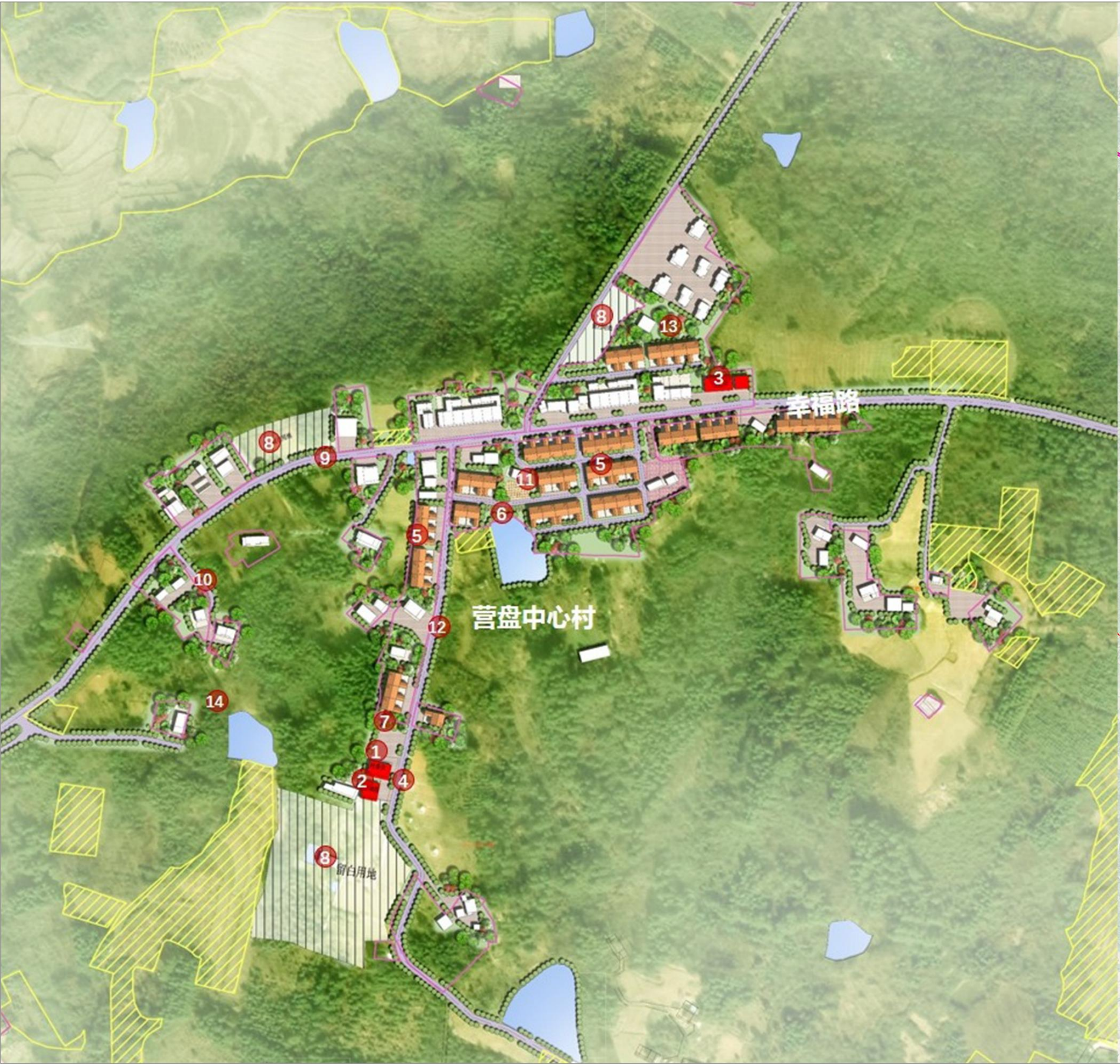
重点区域总平面图