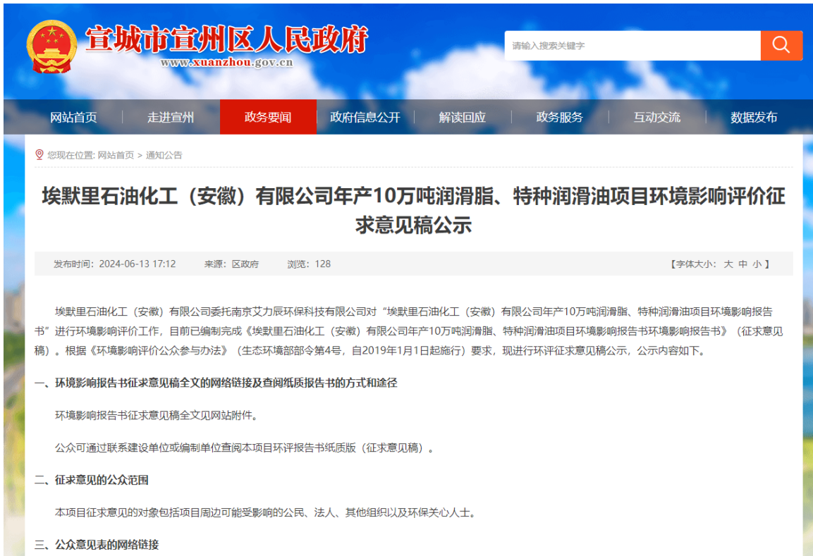
图3.2-1 本项目征求意见稿公示网络截图