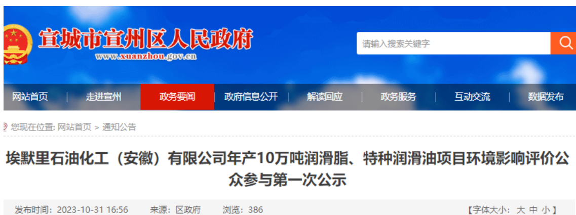
图2.2-1 本项目首次公示网络截图