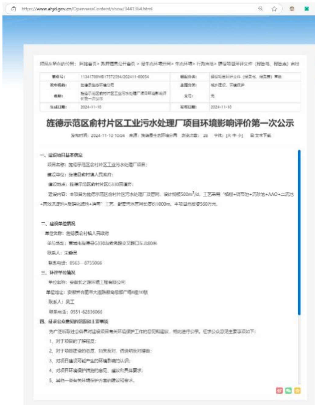
图 1 第一次网络公示截图

首次环境影响评价信息采用网络公示，公示网站为旌德县人民政府网站。 网页截图见图 1。