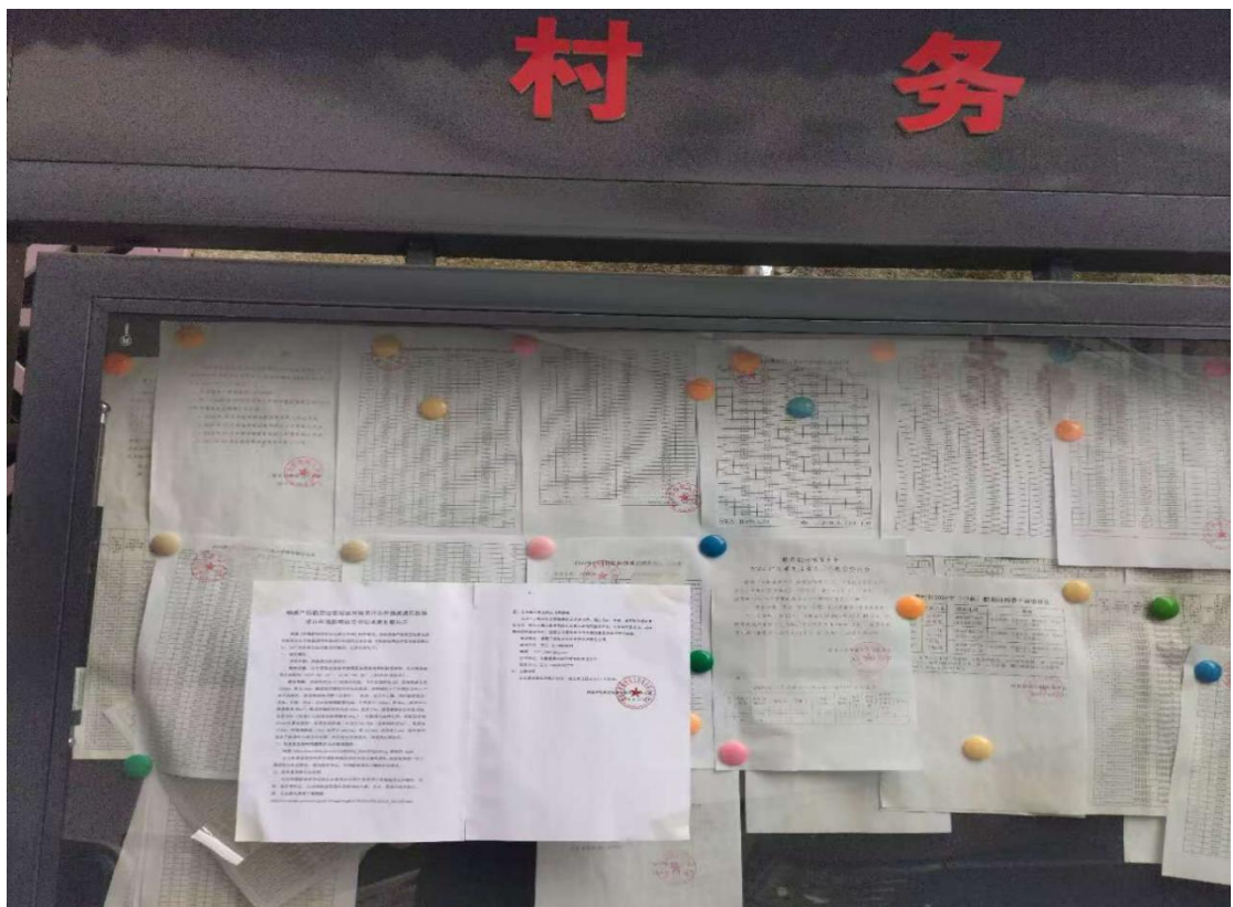
图 3-6 桂林镇黄村村张贴公示