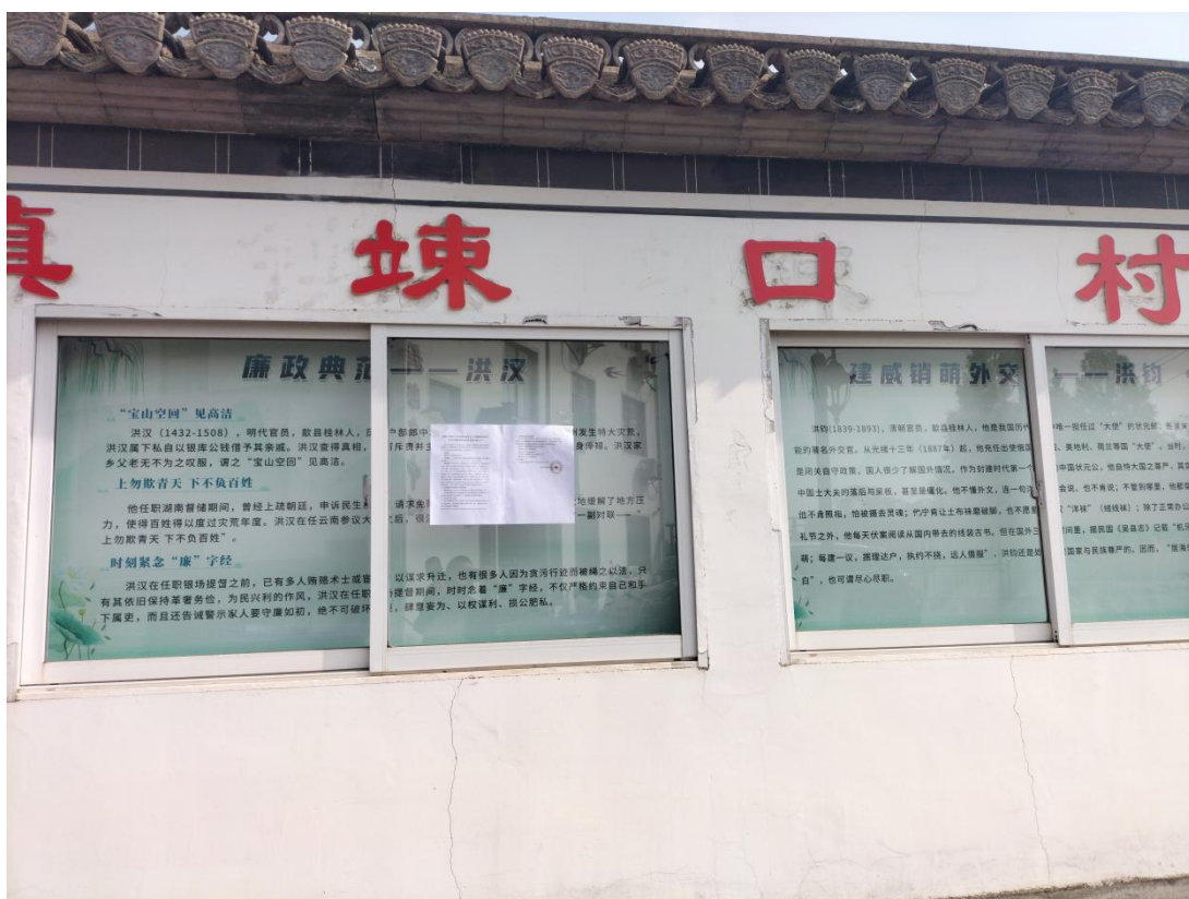
图 3-5 桂林镇竦口村张贴公示