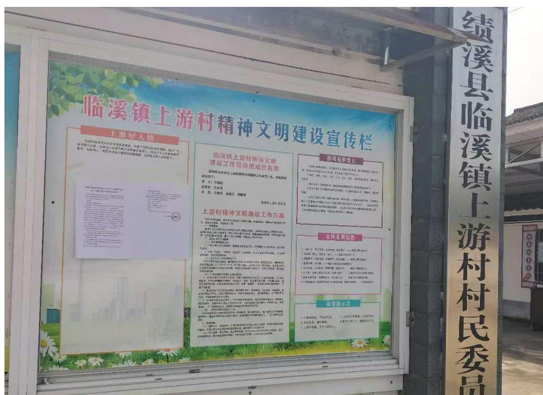
图 3-3 临溪镇上游村张贴公示