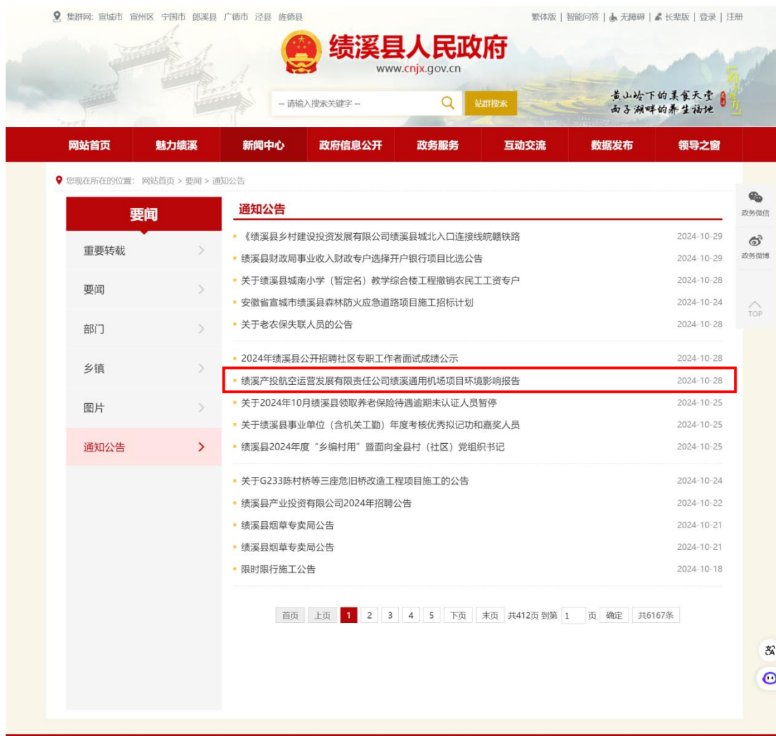
图 3-1 绩溪县人民政府网站征求意见稿公示截图（1）