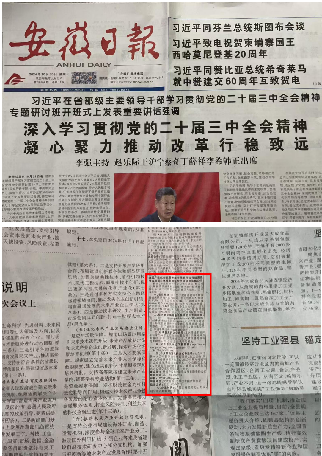
图 3-9 报纸公示截图（第二期）