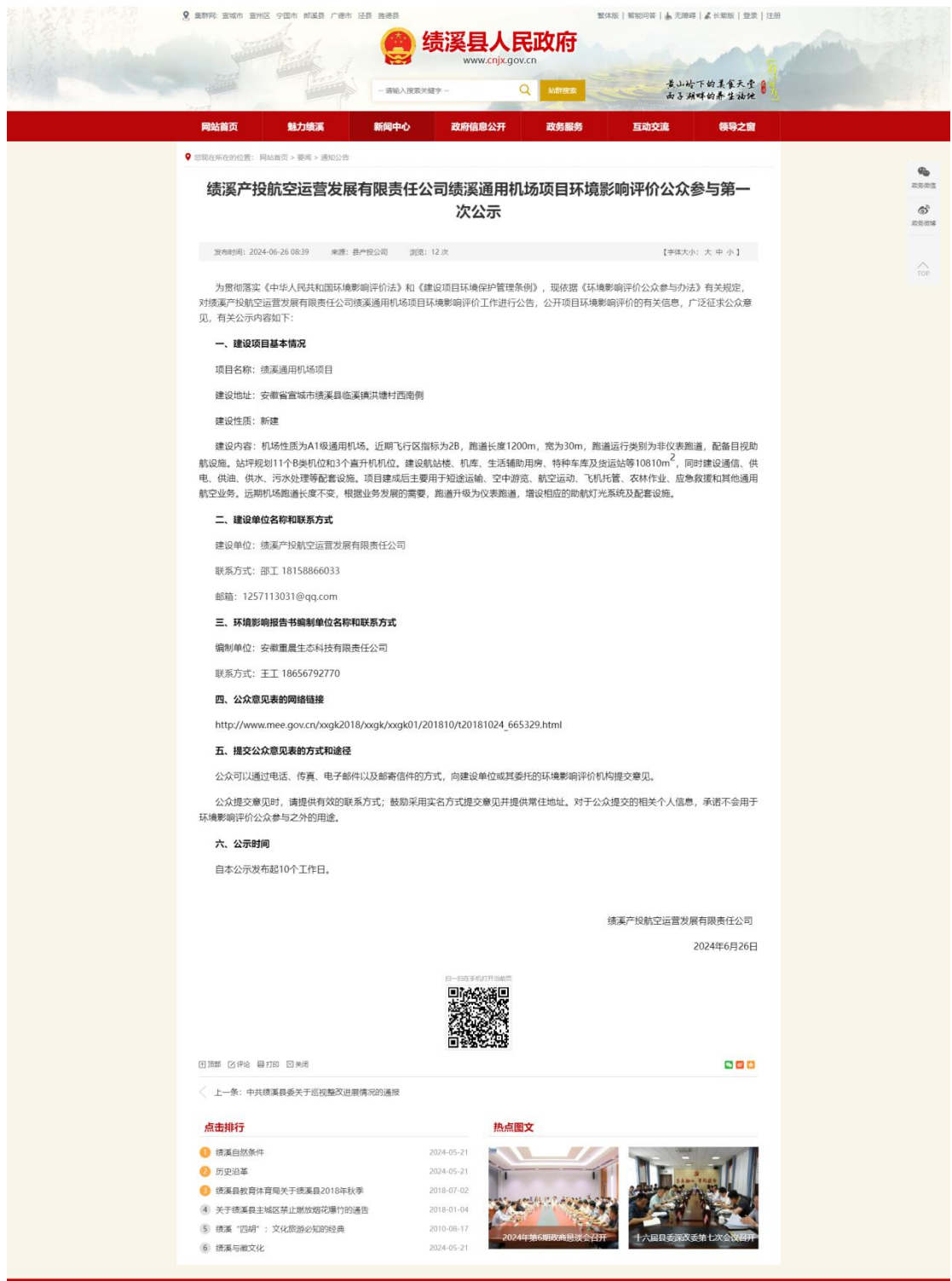
图 2-2 绩溪县人民政府网站第一次公示截图（2）