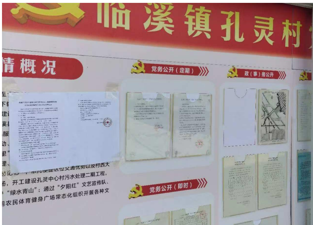
图 3-4 临溪镇孔灵村张贴公示