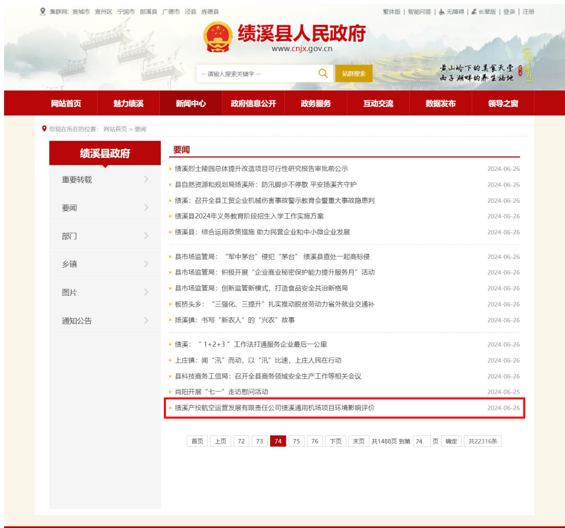
图 2-1 绩溪县人民政府网站第一次公示截图（1）