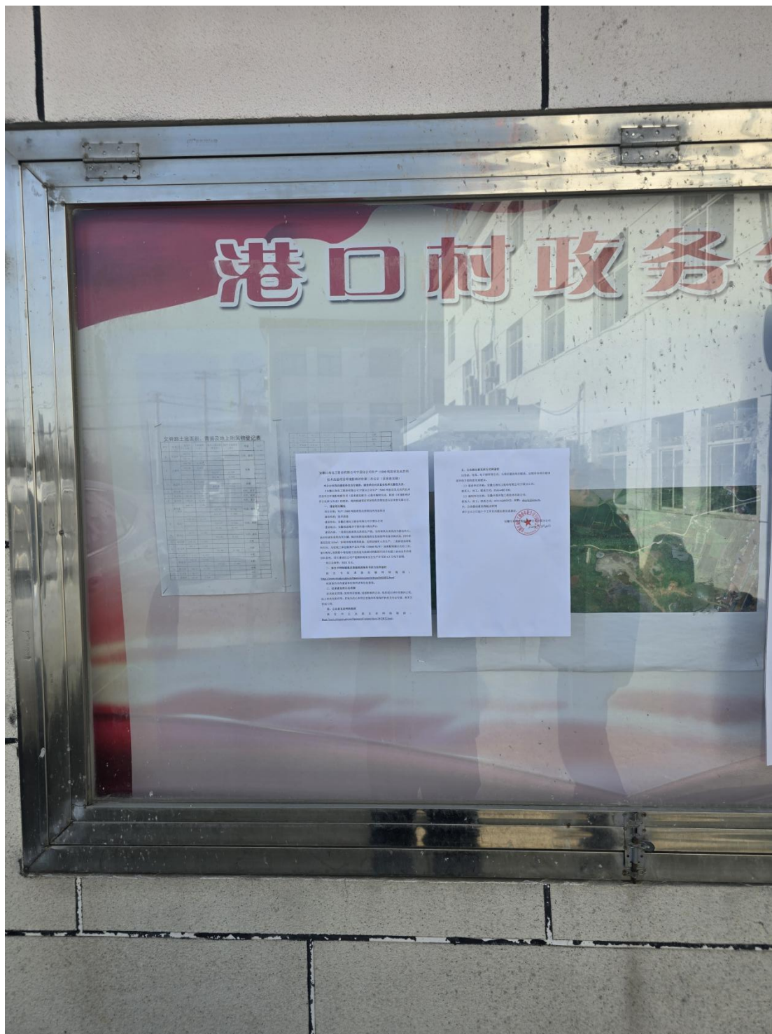
图 5 港口村村委会公开栏张贴环境影响评价信息第二次公示 (a)

安徽江南化工股份有限公司宁国分公司于 12 月 20 日在港口村村委会、项目建设地点进行了建设项目环境影响评价信息第二次公示。