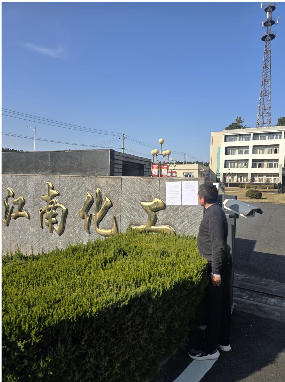
图 8 建设地点周边张贴环境影响评价信息第二次公示（d）