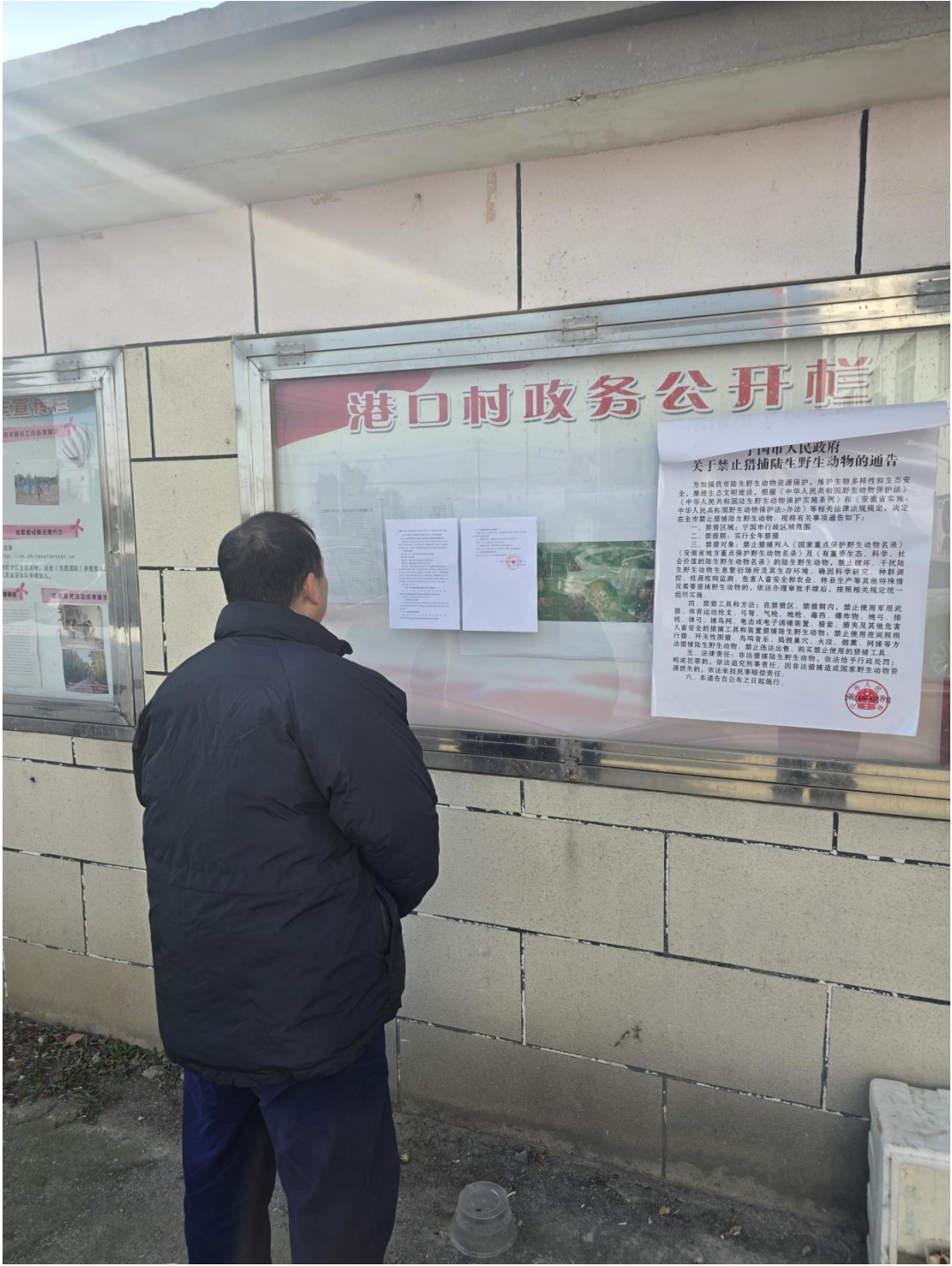
图 6 港口村村委会公开栏张贴环境影响评价信息第二次公示 (b)