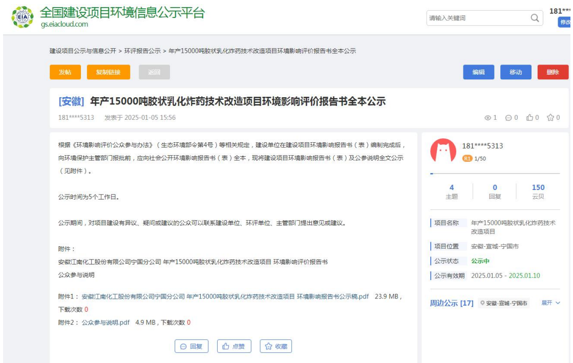
图 9 建设项目环境影响评价信息全本公示