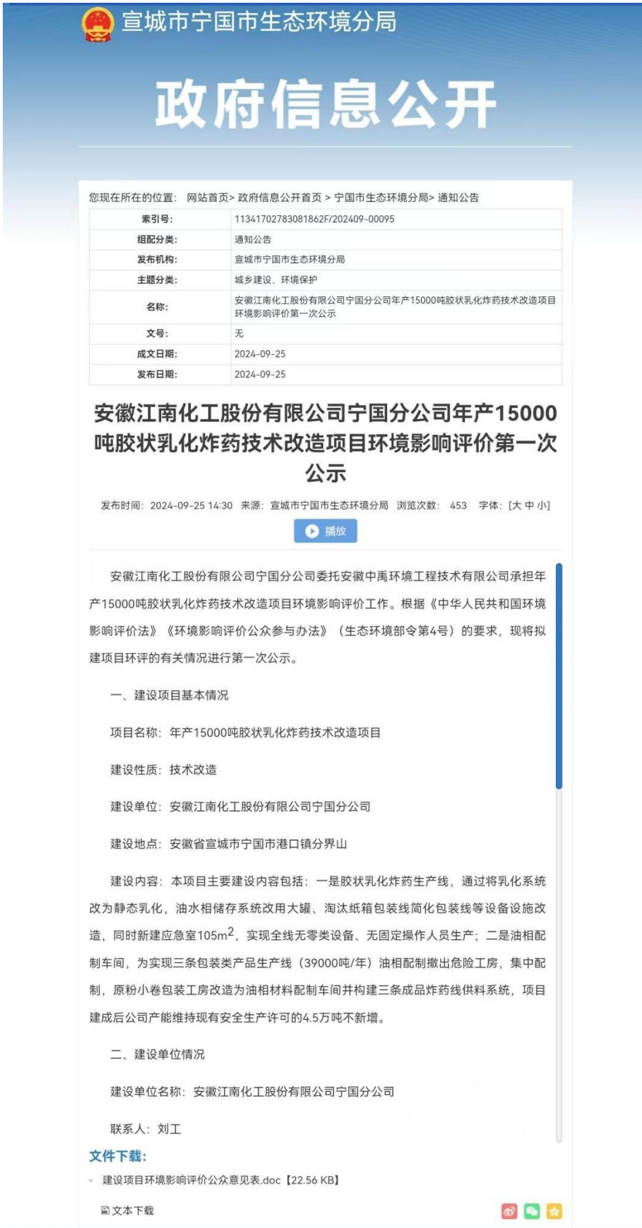
图 1 建设项目环境影响评价信息第一次公示