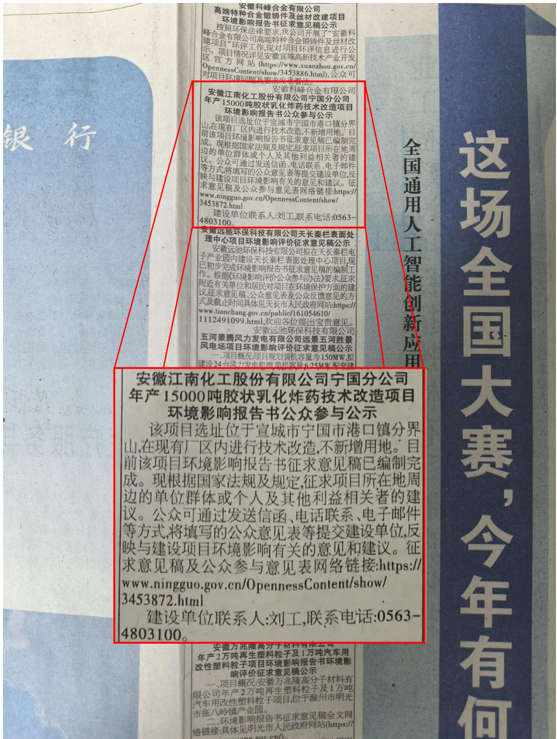
图 4 建设项目环境影响评价信息报纸第二次公示 (b)