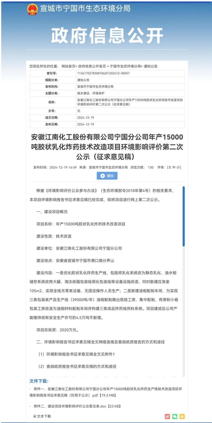
图 2 建设项目环境影响评价信息网络第二次公示