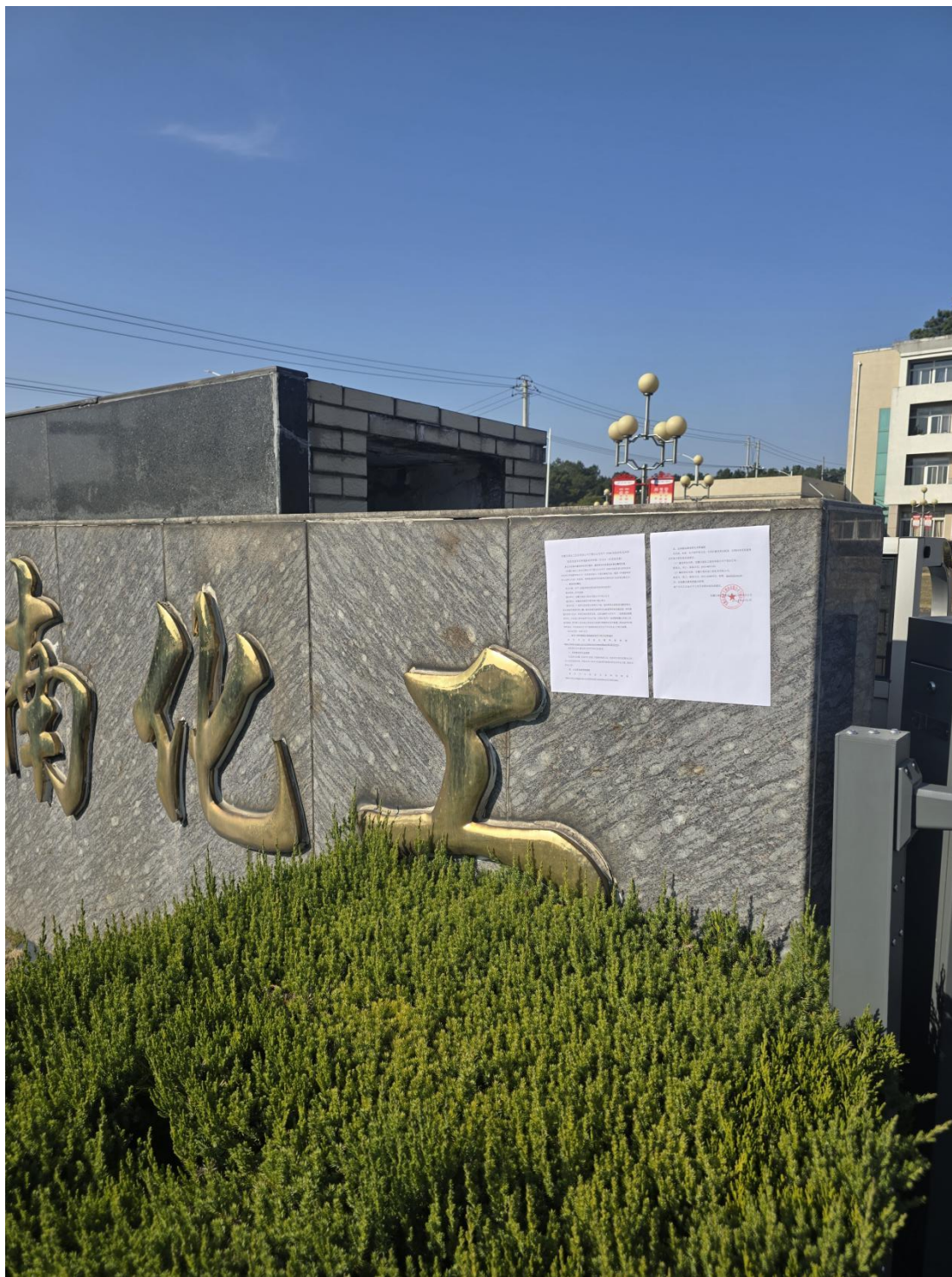
图 7 建设地点张贴环境影响评价信息第二次公示 (c)