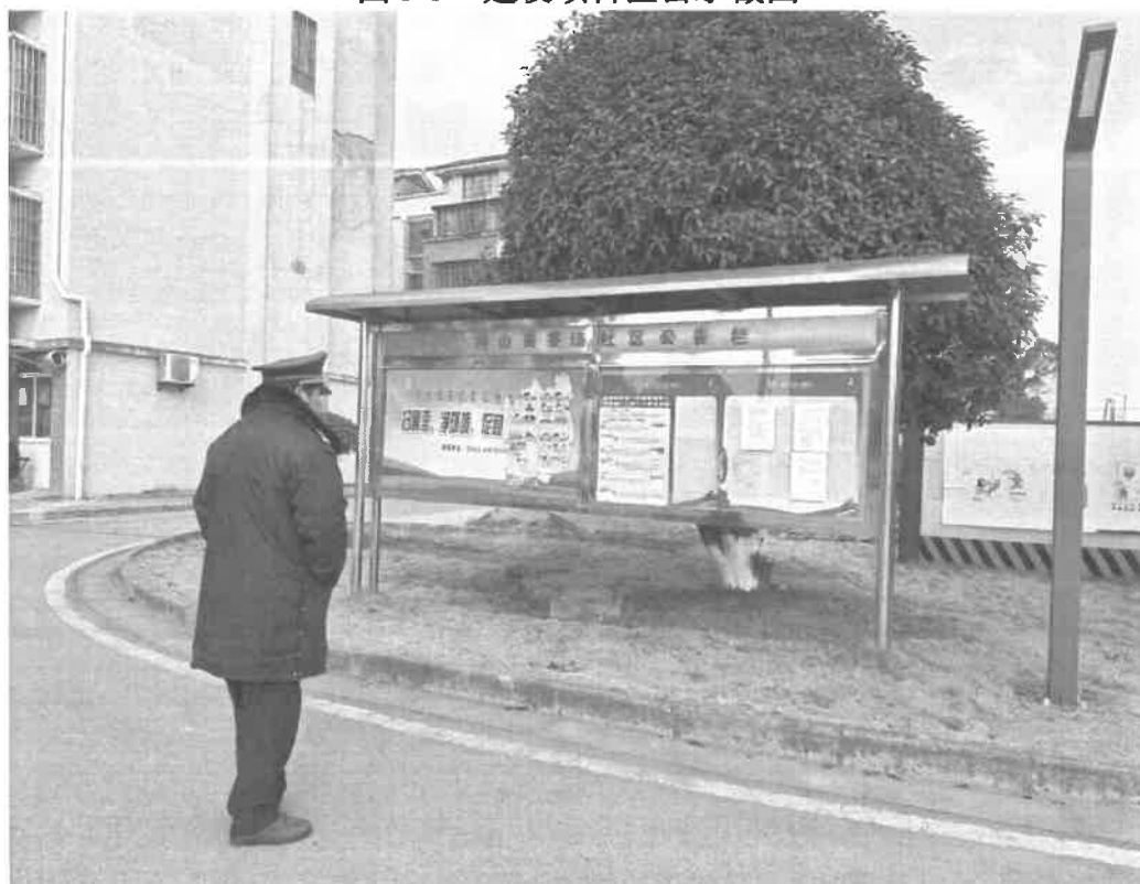
图 3-6 建设项目周边小区公示截图（东晟花园）