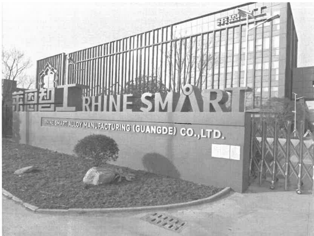
图 3-5 建设项目区公示截图