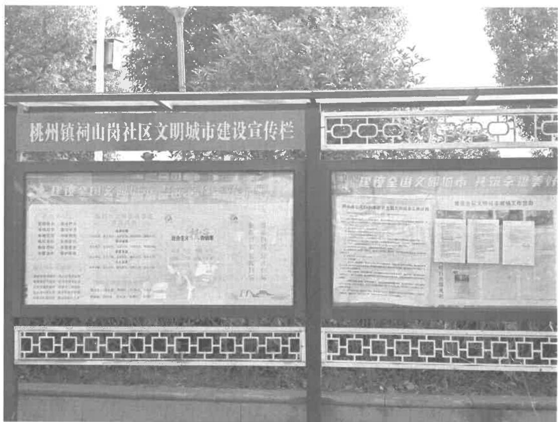
图 3-7 建设项目周边小区公示截图（祠山岗安置小区）