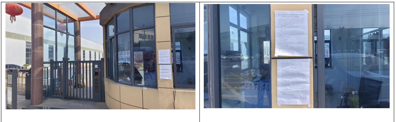
图 3 现场公示截图

征求意见稿公示期间，建设单位在敏感点所在行政村人群密集的地方张贴了公告，广泛征求当地群众对于本项目在环境保护方面的意见。图片如下：