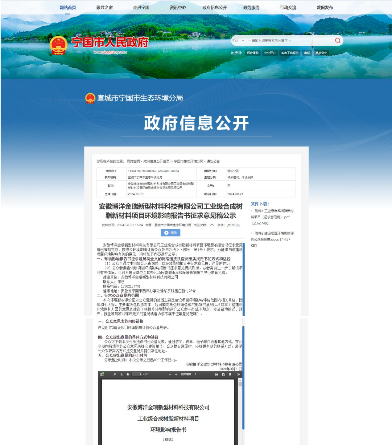
图 3-2-1 环境影响评价公众参与征求意见稿信息网络公开截图

2024 年 8 月 23 日和 2024 年 8 月 26 日建设单位两次在《安徽日报》进行环境影响报告书征求意见稿报纸公示。《安徽日报》是项目所在地（安徽省宣城市宁国市）公众易于接触的报纸，公示载体符合《环境影响评价公众参与办法》要求。