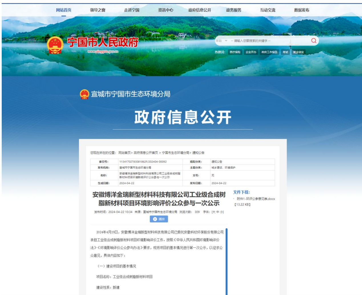
图 2-2-1 环境影响评价公众参与第一次信息网络公开截图