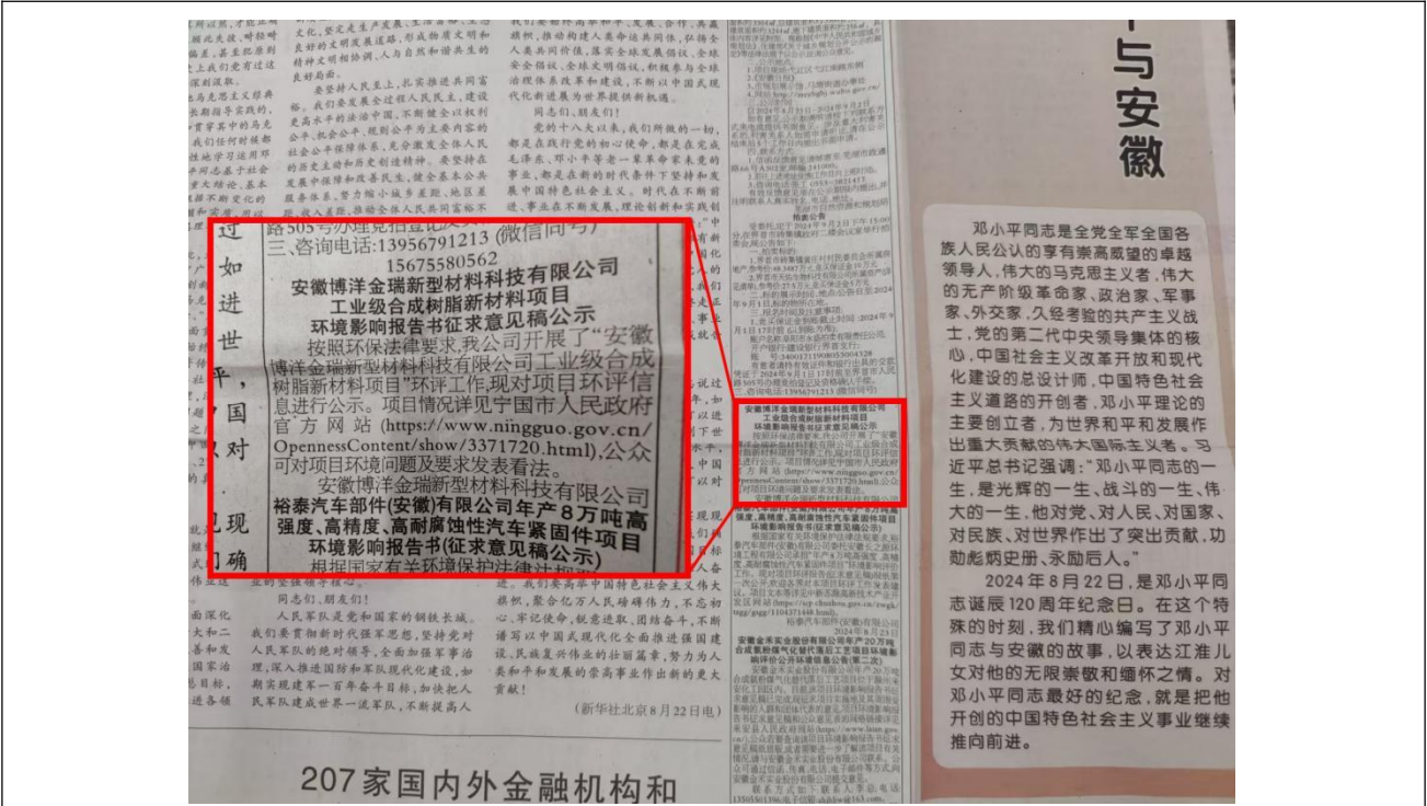
第一次报纸公开截图