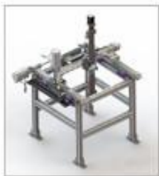
工业机器人及机械手单元