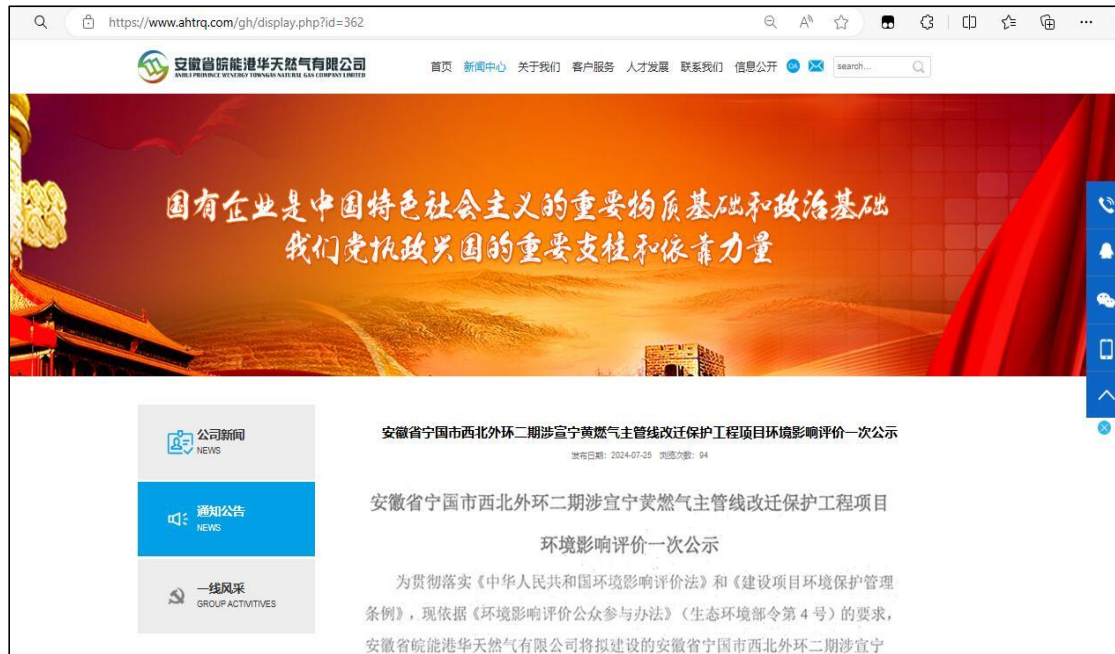
图 2-1 首次公开网络页面截图（1）