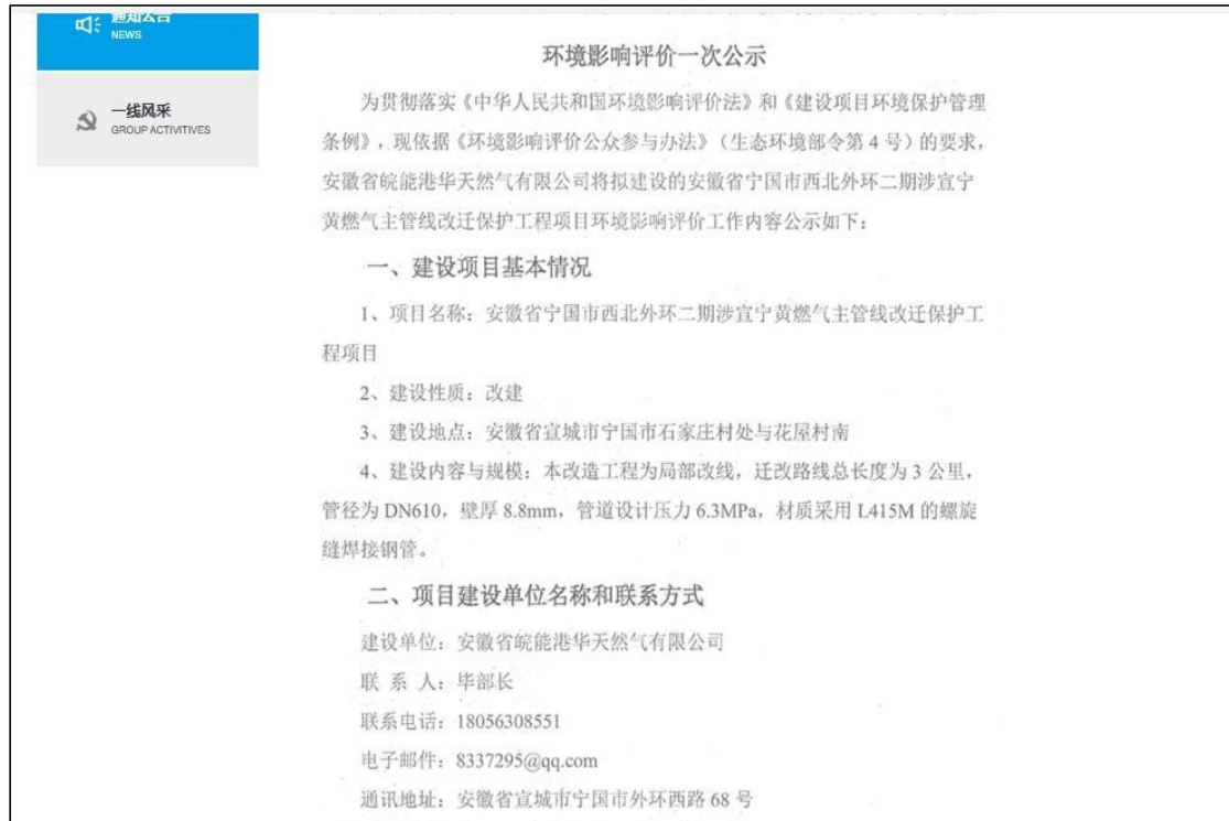
图 2-2 首次公开网络页面截图（2）