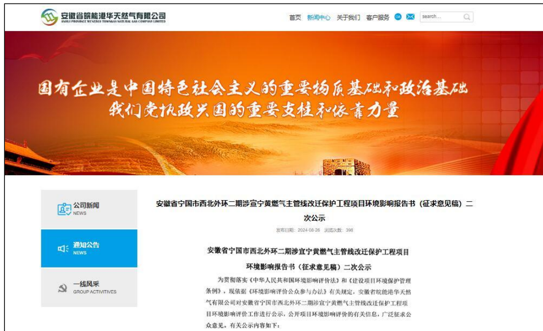
图 3-1 项目环境影响报告书征求意见稿网络公示截图（1）