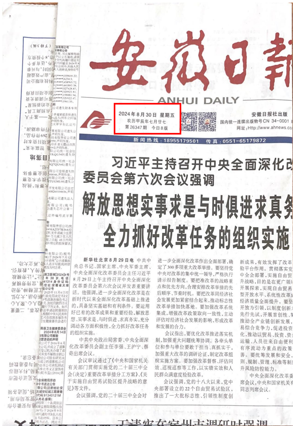
图 3-6 8 月 30 日报纸公示截图 (1)