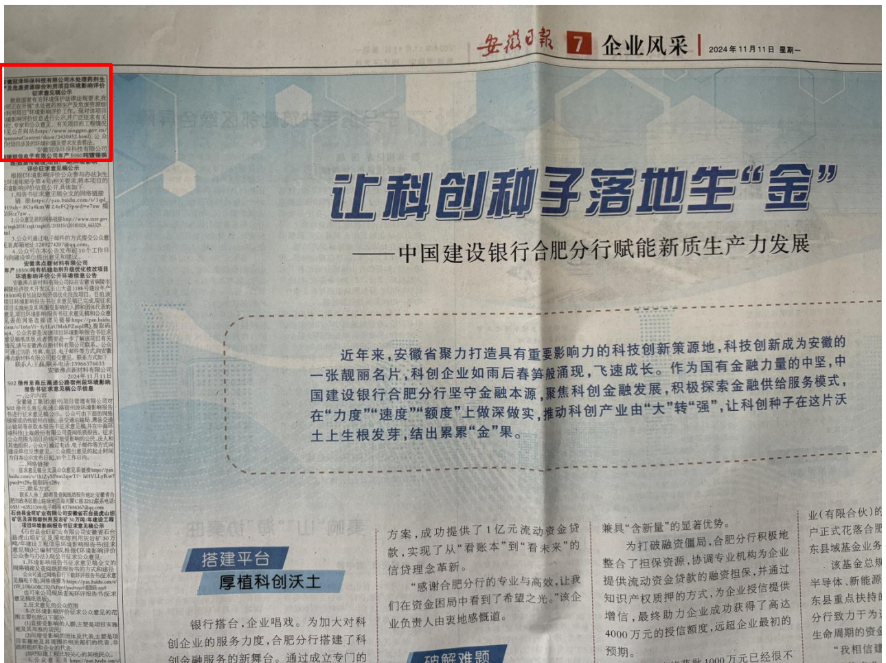
图4 第二次报纸公示截图