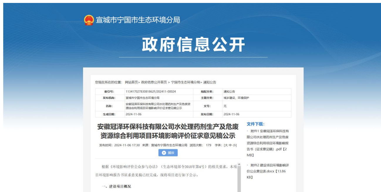
图 2 征求意见稿网络公示截图

2024 年 11 月 6 日在宣城市宁国市生态环境分局网站进行了第二次网络公示，网址为： https://www.ningguo.gov.cn/OpennessContent/show/3430452.html ，公示的载体符合《环境影响评价公众参与暂行办法》的要求。