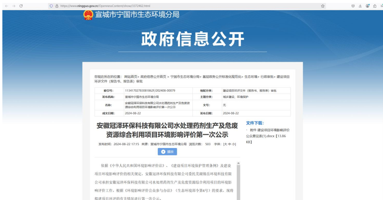
图 1 第一次网络公示截图