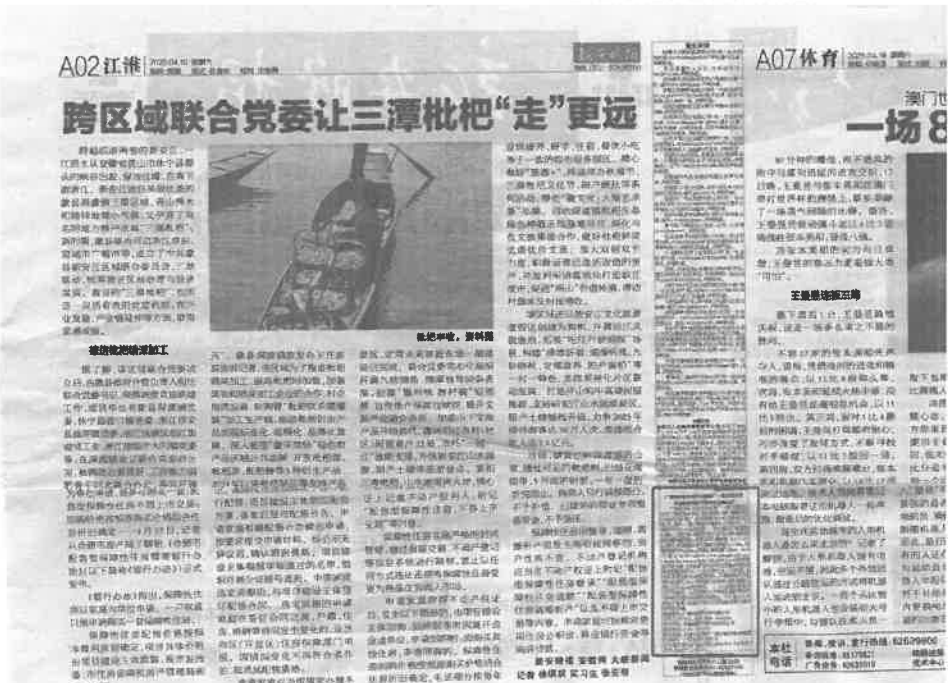
图 3-3 建设项目 2025 年 4 月 19 日报纸公示截图