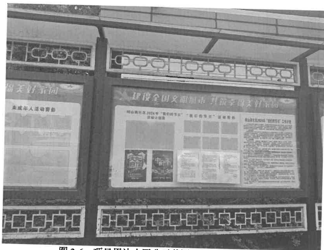
图 3-6 项目周边小区公示截图（祠山岗小区）