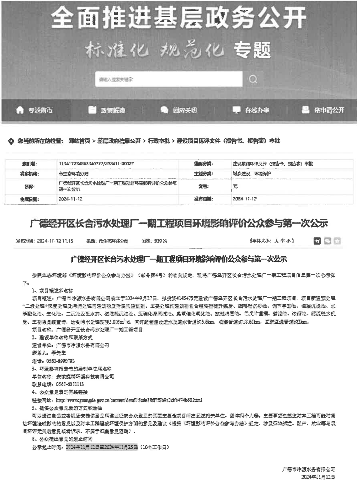
图 2-1 建设首次网络公示截图