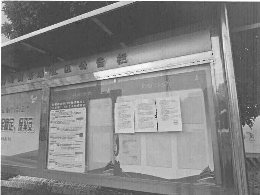
图 3-5 项目周边小区公示截图（东昇花园）