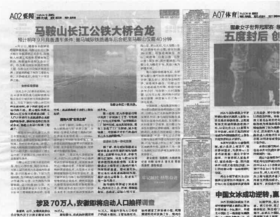
图 3-2 建设项目 2025 年 4 月 18 日报纸公示截图

报纸公示的时间为：2025 年 4 月 18 日、2025 年 4 月 19 日。共计 2 次。 报纸公示内容符合公参办法要求。公示图片如下：