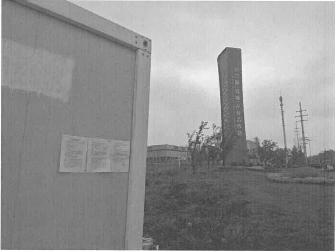
图 3-4 项目区公示截图