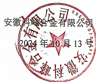
图 2-1 项目委托函