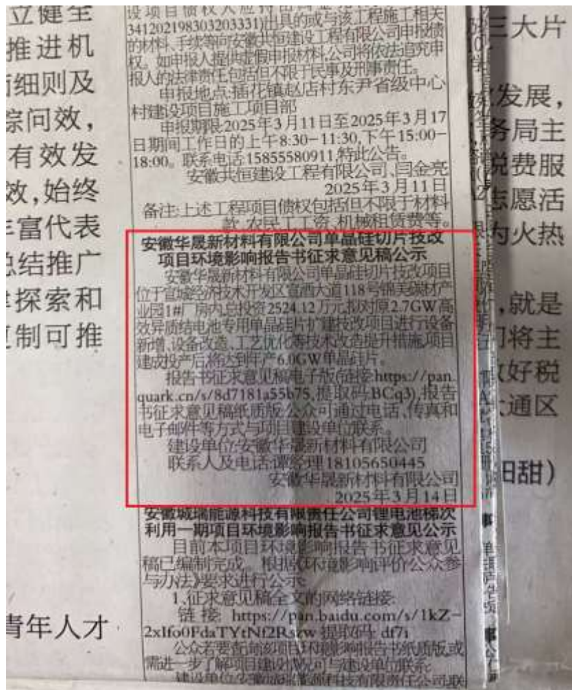
图 3.3 第二次报纸公示截图