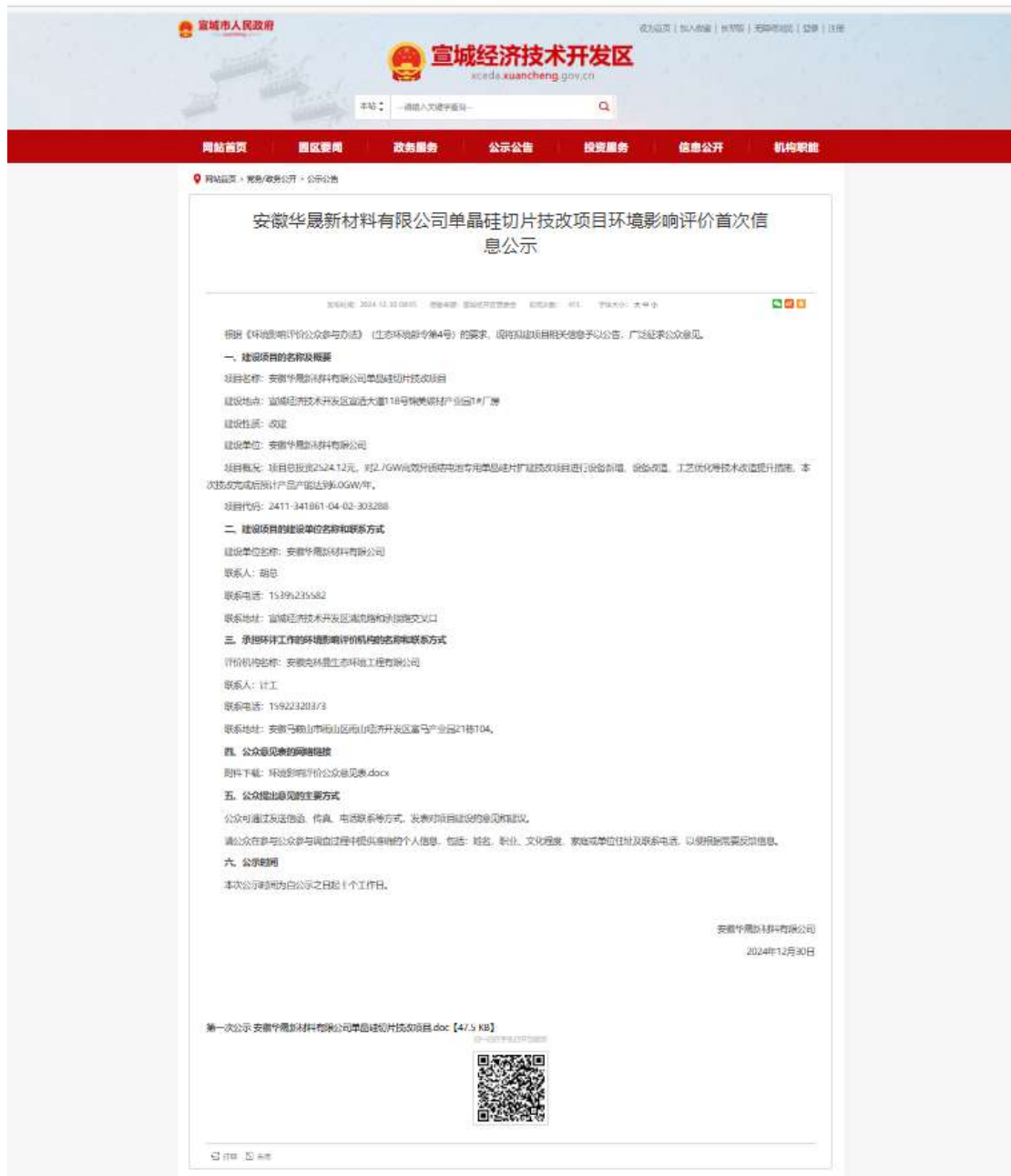
图 2.1 环境影响评价公众参与第一次信息公开截图