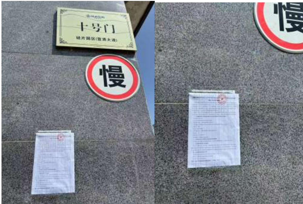
图 3.4 环境影响评价公众参与征求意见稿公告张贴（锦美碳材园区）