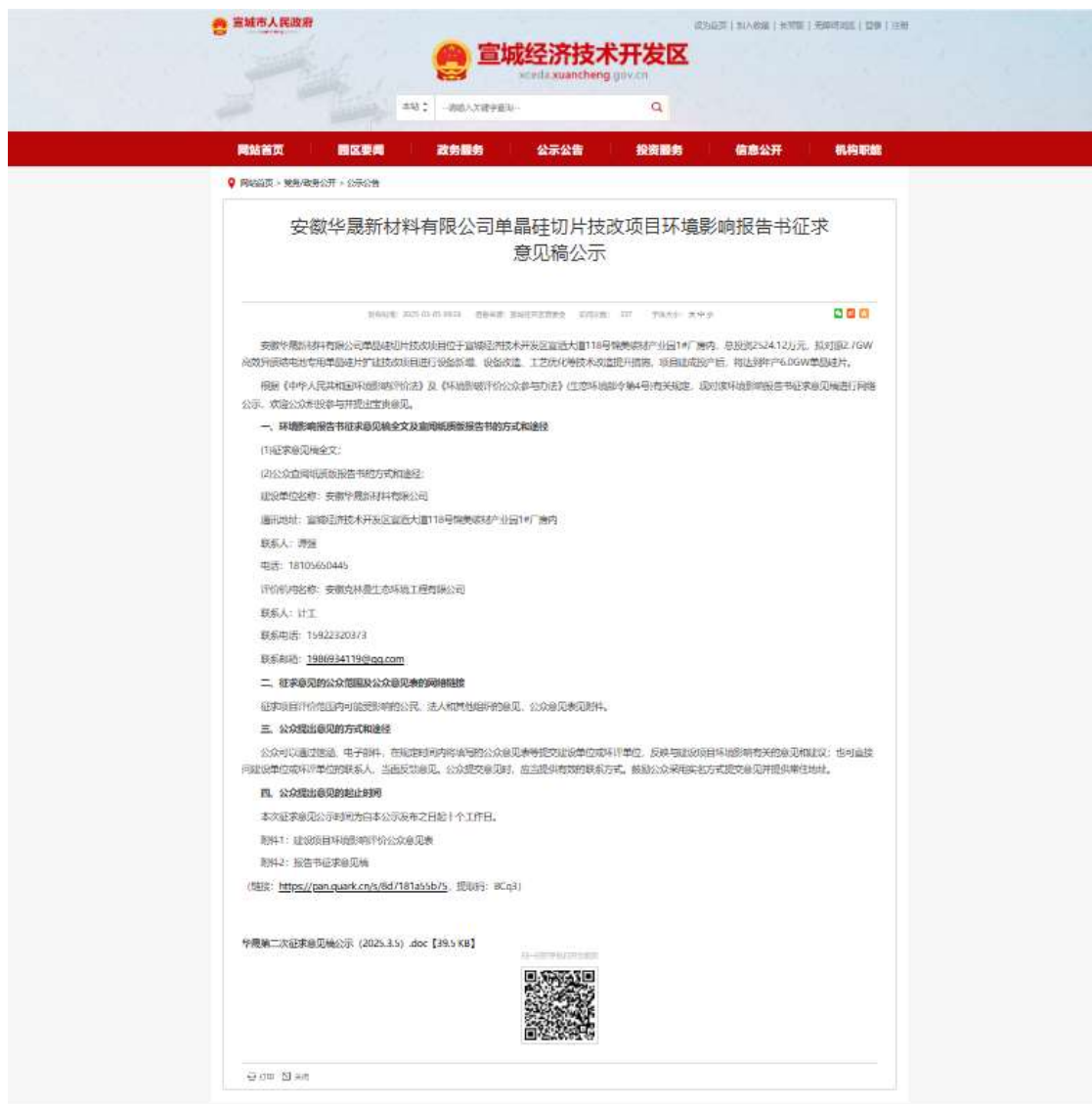
图 3.1 环境影响评价公众参与征求意见稿网络公示截图

市人民政府网站是项目所在地政府网站，符合《办法》要求。公示时间 2025 年 3 月 5 日至 2025 年 3 月 18 日（满 10 个工作日）。具体公示情况见图 3.1 所示。其网址如下：（ https://xceda.xuancheng.gov.cn/News/show/1621105.html ）。