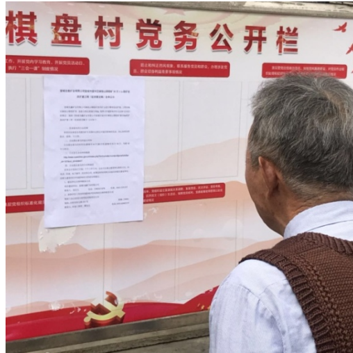
图 5 公众参与信息公告张贴