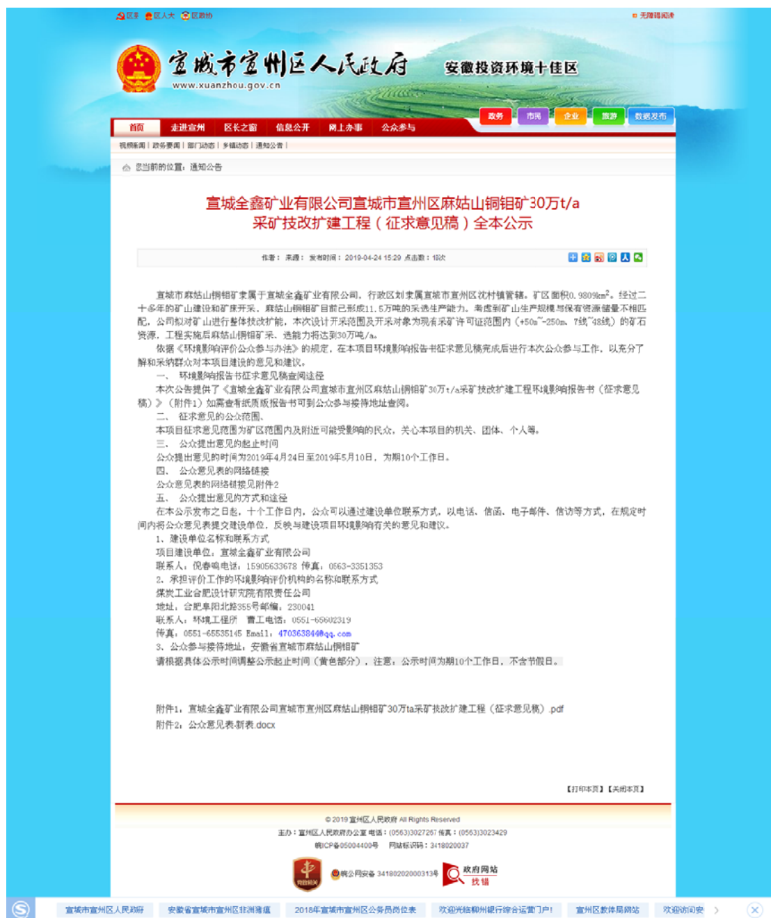
图 2 宣城市宣州区人民政府网站第二次环评信息公告图