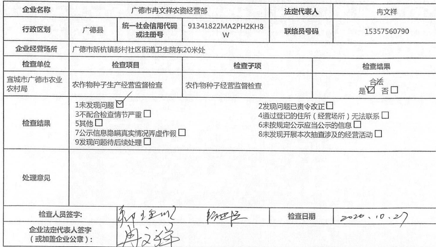
宣城市广德市农业农村局随机抽查检查表