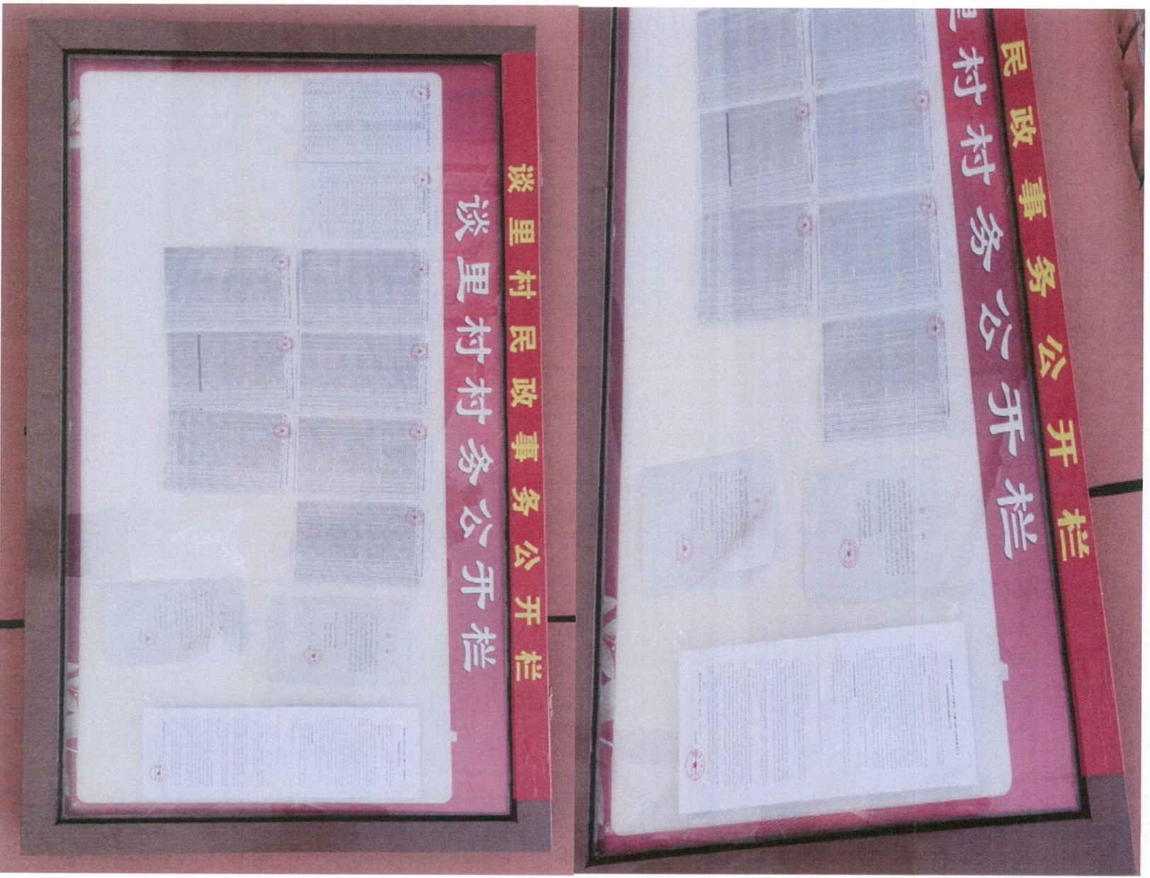
图 3.4 (3)