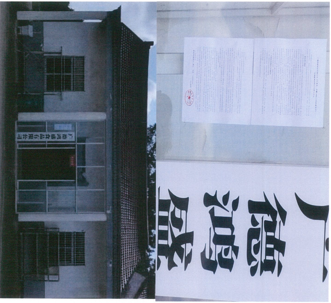
图 3.4 (1) 环境影响评价公众参与征求意见稿张贴(广德鸿盛食品有限公司厂区)

根据《办法》第十一条第三款，需通过在建设项目所在地公众易于知悉的场所张贴公告的方式公开，本次公开选择在当地村委会、乡镇及项目现场张贴公告，社区居民等均是建设项目所在地公众易于知悉的场所，符合《办法》要求。张贴时间为2021年1月26日。具体公示情况如图3.4所示。