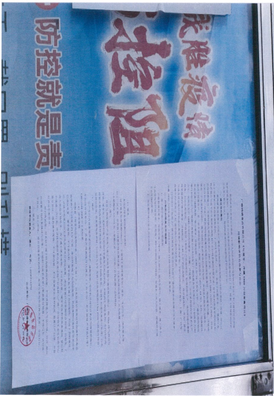
图 3.4 (2) 环境影响评价公众参与征求意见稿公告张贴 (广德市邱村镇赵村村委会)