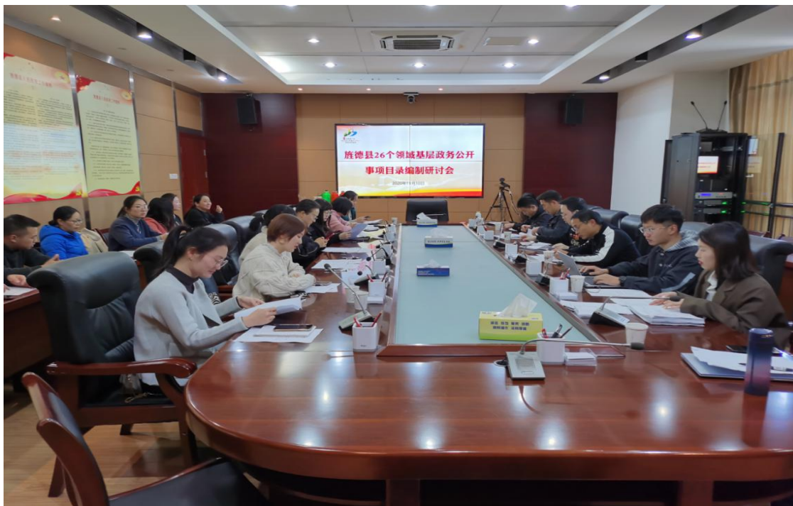
召开二次基层政务公开目录编制会议，按时按量级完成县、乡两级基层公开事项目录编制工作