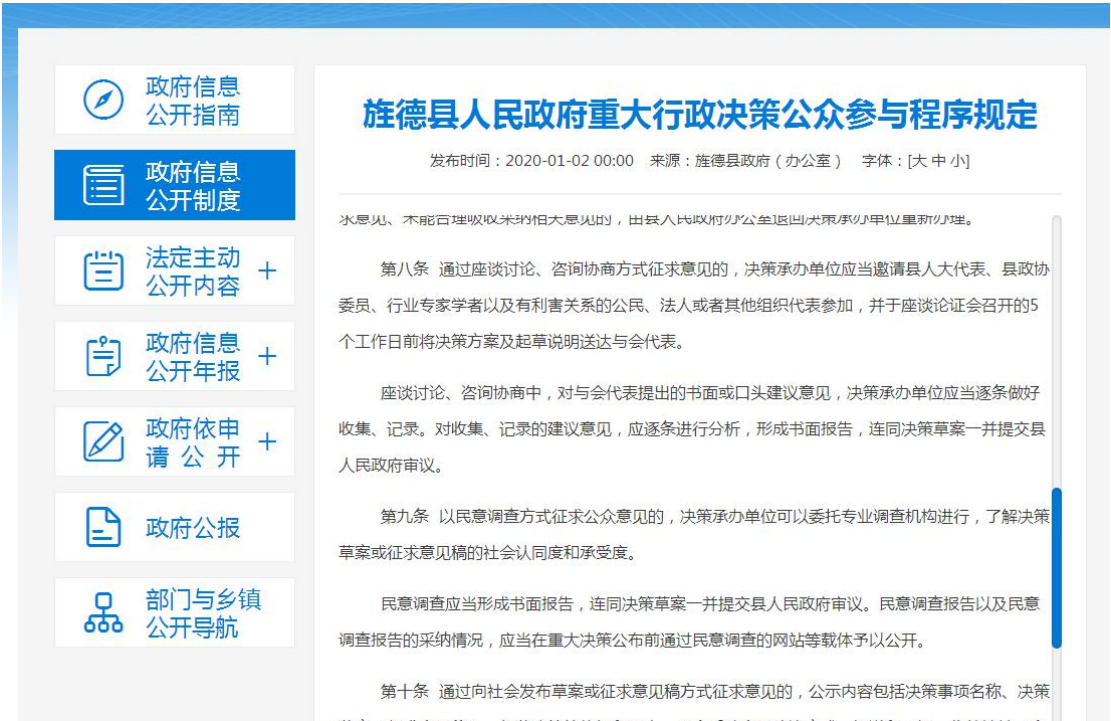
旌德县人民政府重大行政决策公众参与程序规定

链接： http://www.ahjd.gov.cn/XxgkRules/show/4260.html