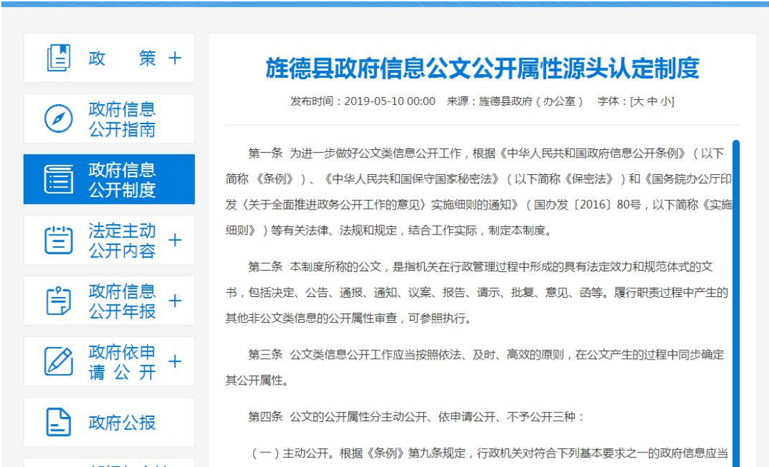
旌德县政府信息公开属性源头认定制度

链接： http://www.ahjd.gov.cn/XxgkRules/show/4260.html