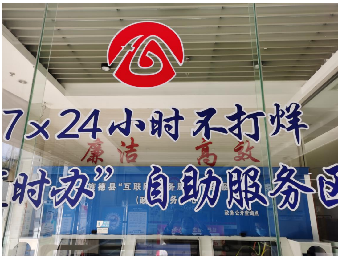
顺德区县级政务公开示范区建设