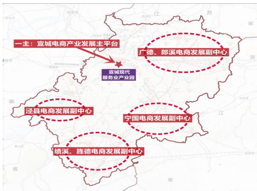
图 4.1：宣城市电子商务产业发展空间布局示意图

宣城电子商务产业发展主平台位于宣城市现代服务业产业园区内，是规划期内宣城市重点打造的电子商务产业发展功能区，也是电商产业集聚度最高、业态最完整、配套最齐全的功能区，对全市电商发展起到资源链接、服务输出、全程孵化、创业创新等产业枢纽作用。根据宣城电子商务产业发展主平台定位，现代服务业产业园内规划四个电子商务产业发展功能区：电商孵化与公共服务功能区、电商总部服务集聚区、电商物流仓储功能区、羽绒产业电商发展功能区。