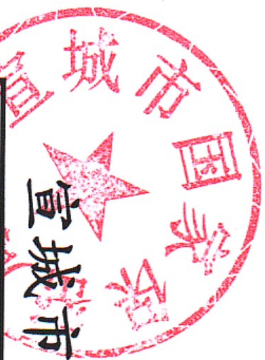
宣城市国家保密局2021年度行政许可实施情况统计表