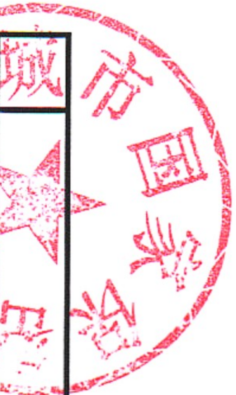
宣城市国家保密局2021年度行政处罚实施情况统计表