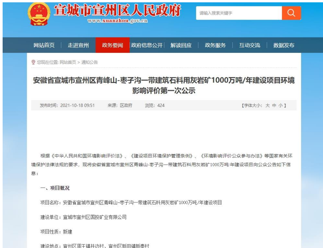
图1 本项目首次环境影响评价信息公开情况截图

因此,宣城市宣州区国投矿业有限公司于2021年10月17日委托宣城市宣州区国投环境科技有限公司进行环境影响报告书编制后七日内,即选择在宣城市宣州区人民政府门户网站开展了项目首次环境影响评价信息公开(2021年10月18日),公示内容按照“第九条”的要求公示了项目名称、厂址、内容、建设单位、联系方式,环境影响报告书编制单位名称、公众参与表格和提交意见表的方式和途径(具体网络公示的截图见下图1)。公示中提到在环境影响报告书征求意见稿编制过程中,欢迎公众向建设单位提出与环境影响评价相关的意见。首次公示网站的链接为: http://www.xuanzhou.gov.cn/News/show/1291815.html 。