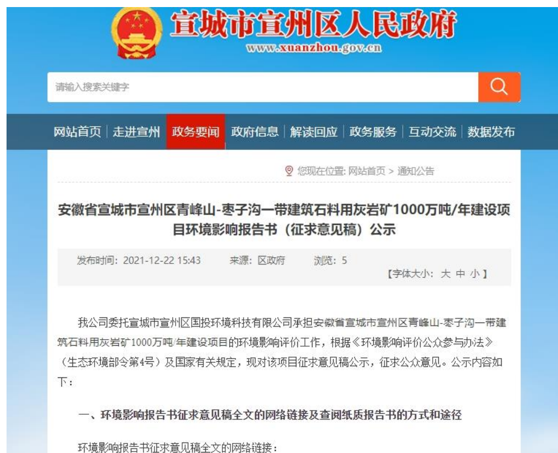
图2 项目环境影响报告书征求意见稿及公参调查表网络公示截图

项目环境影响报告书征求意见稿网络公示选择的载体为宣城市宣州区人民政府门户网站，该网站为建设项目的所在地网站，网络公示平台的选取符合《环境影响评价公众参与办法》的相关要求。征求意见稿及公参调查表下载链接为： http://www.xuanzhou.gov.cn/News/show/1309357.html ，网络公示时间按照要求设置为：2021年12月22日~2022年1月5日，有效公示时间为10天，满足《环境影响评价公众参与办法》中“持续公开期限不得少于10个工作日”的要求。本次网络公示的截图见下图2所示。