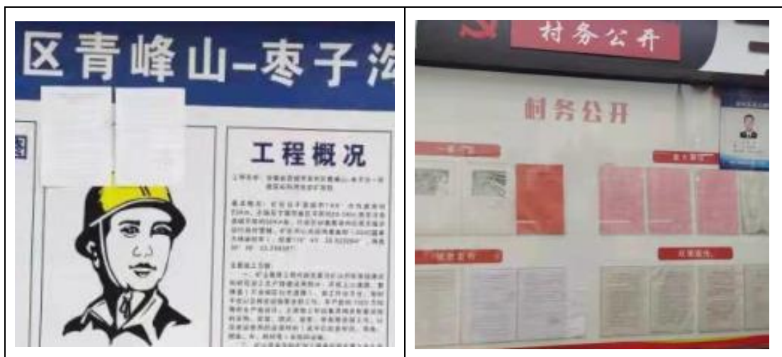
图 4 环境影响报告书征求意见稿张贴公告照片