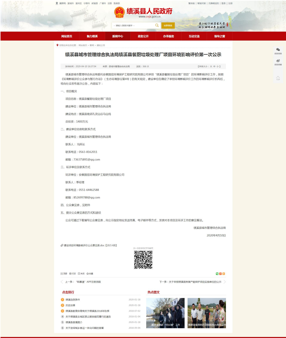
图 1 绩溪县人民政府网站首次公示截图

（ http://www.cnjx.gov.cn/News/show/1114440.html ）上进行了《绩溪县城市管理综合执法局绩溪县餐厨垃圾处理厂项目环境影响评价第一次公示》。