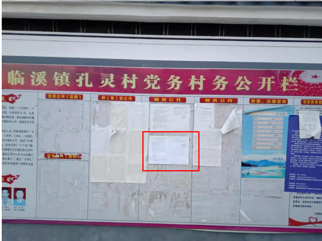
图5 项目现场张贴公告照片