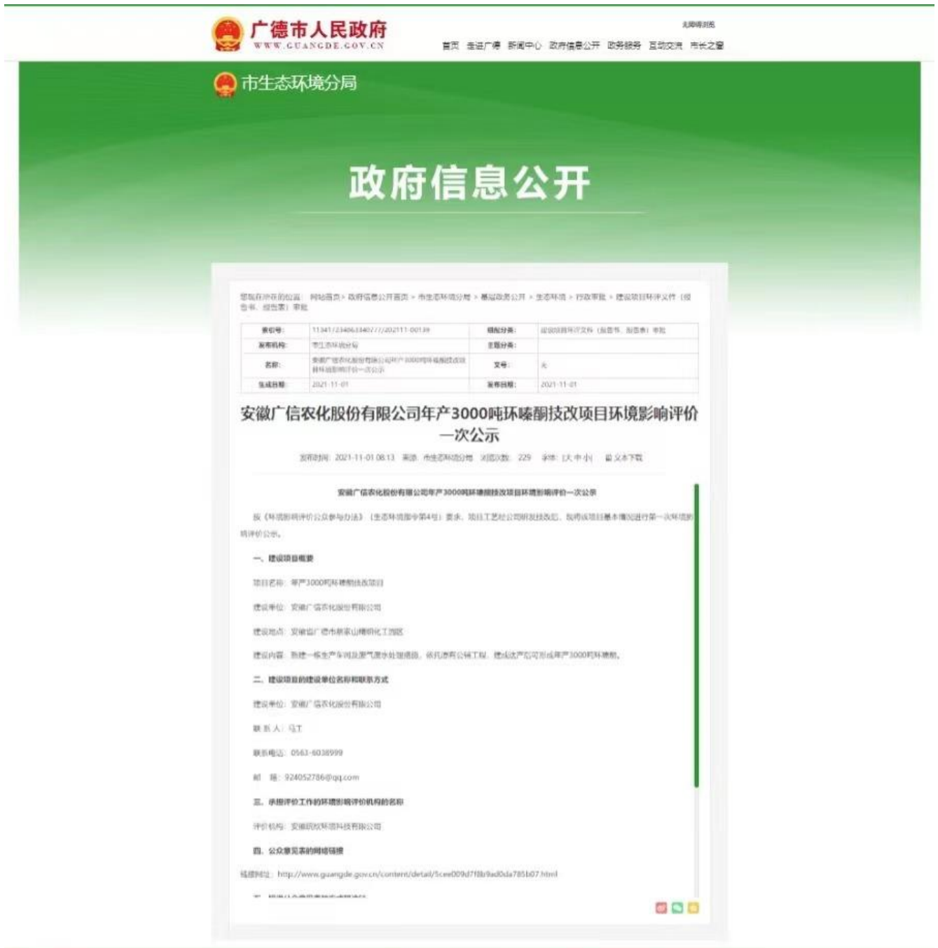
图1 本项目首次公示网络截图

广德市人民政府网站为建设项目所在地相关政府网站，符合《环境影响评价公众参与办法》要求。