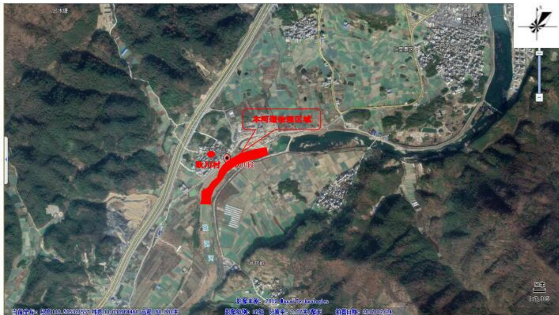
附图 2 项目周边敏感点示意图