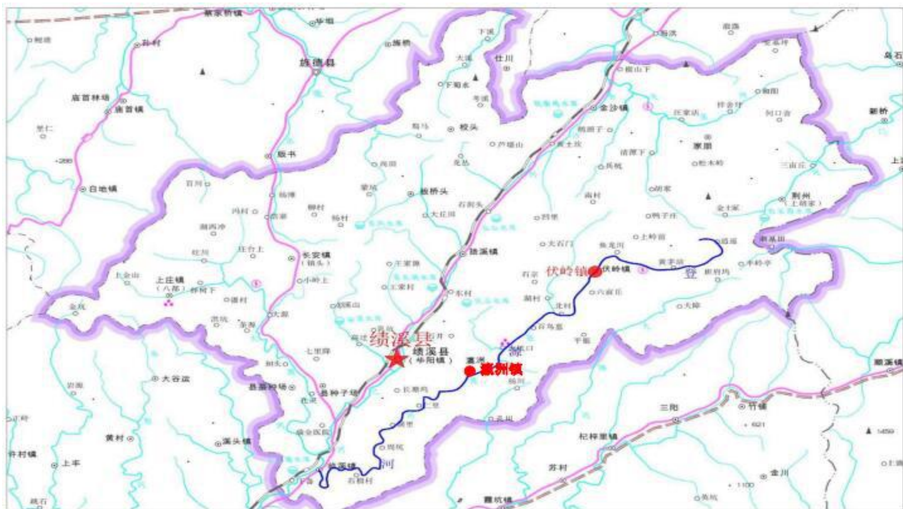
附图 4 区域水系图