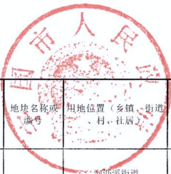
宁国市2022年第17批次城镇建设用地情况一览表