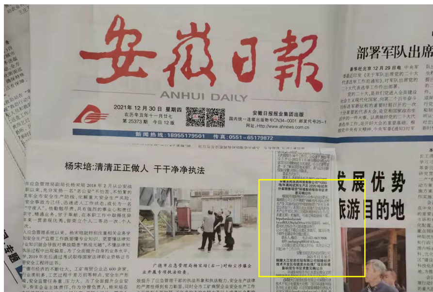
图 4 建设项目环境影响评价信息报纸第二次公示（b）