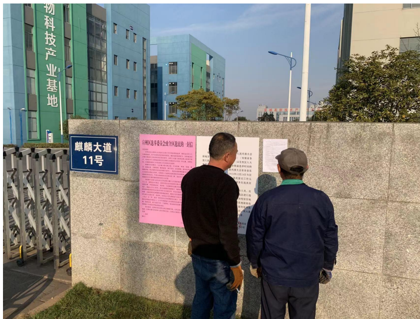
宣城高新技术开发区管委会

建设单位在附近村庄、单位进行了张贴公示，公示地分别为义安经济开发区管委会、健坤大厦。公示照片见下图：