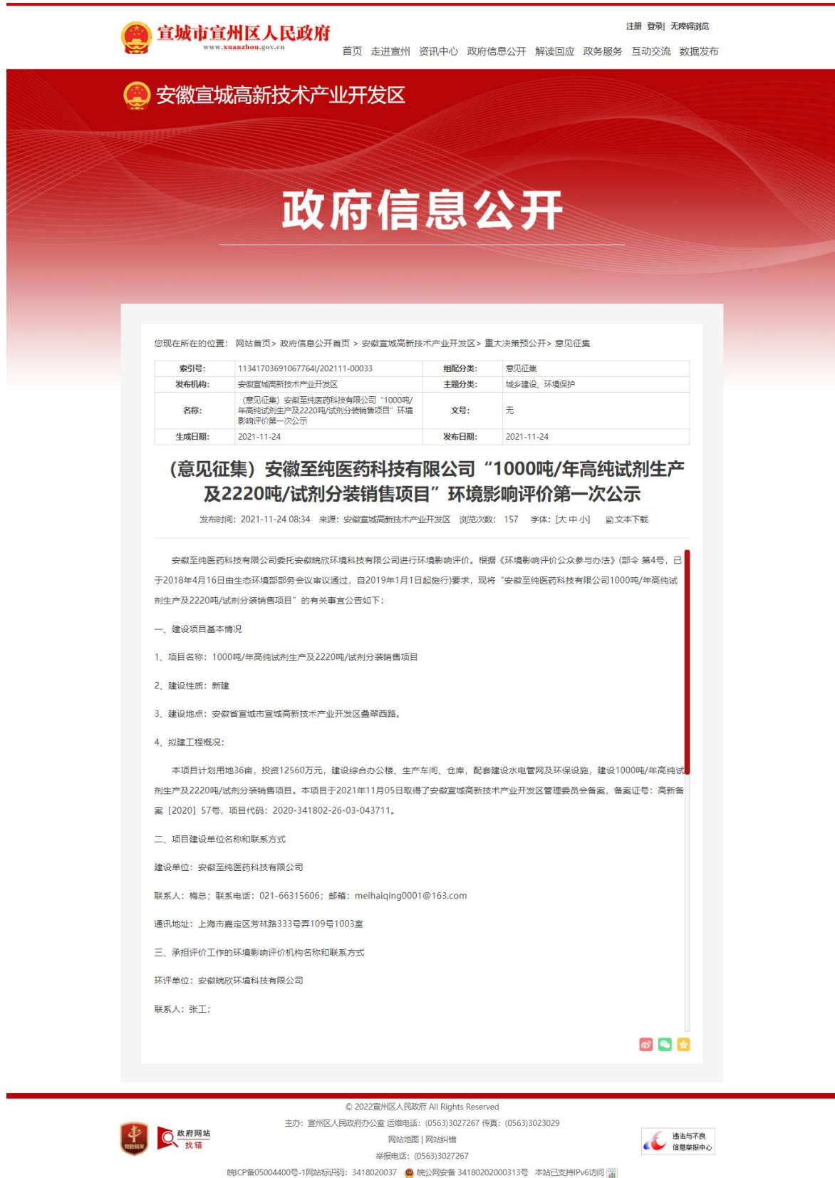
图1 建设项目环境影响评价信息第一次公示