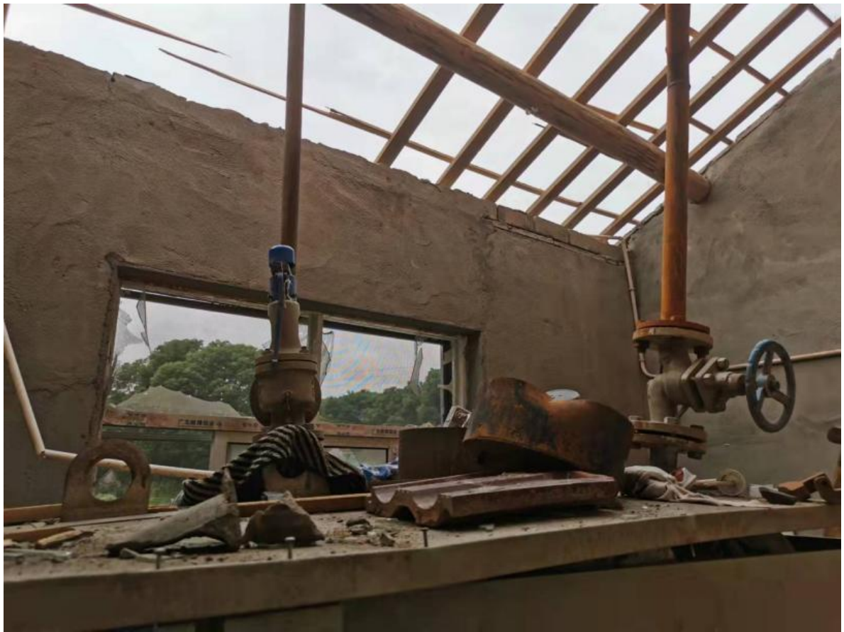
图 1 受损的蒸汽发生器厂房内部

东南方向 35.5 米的厂区院内，击中当时在此等候采购猪肉的龚某某头部，龚某某随即倒地。