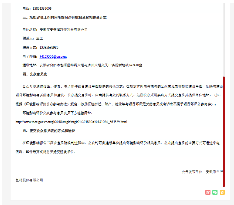
图 2-1 环境影响评价公众参与第一次公示