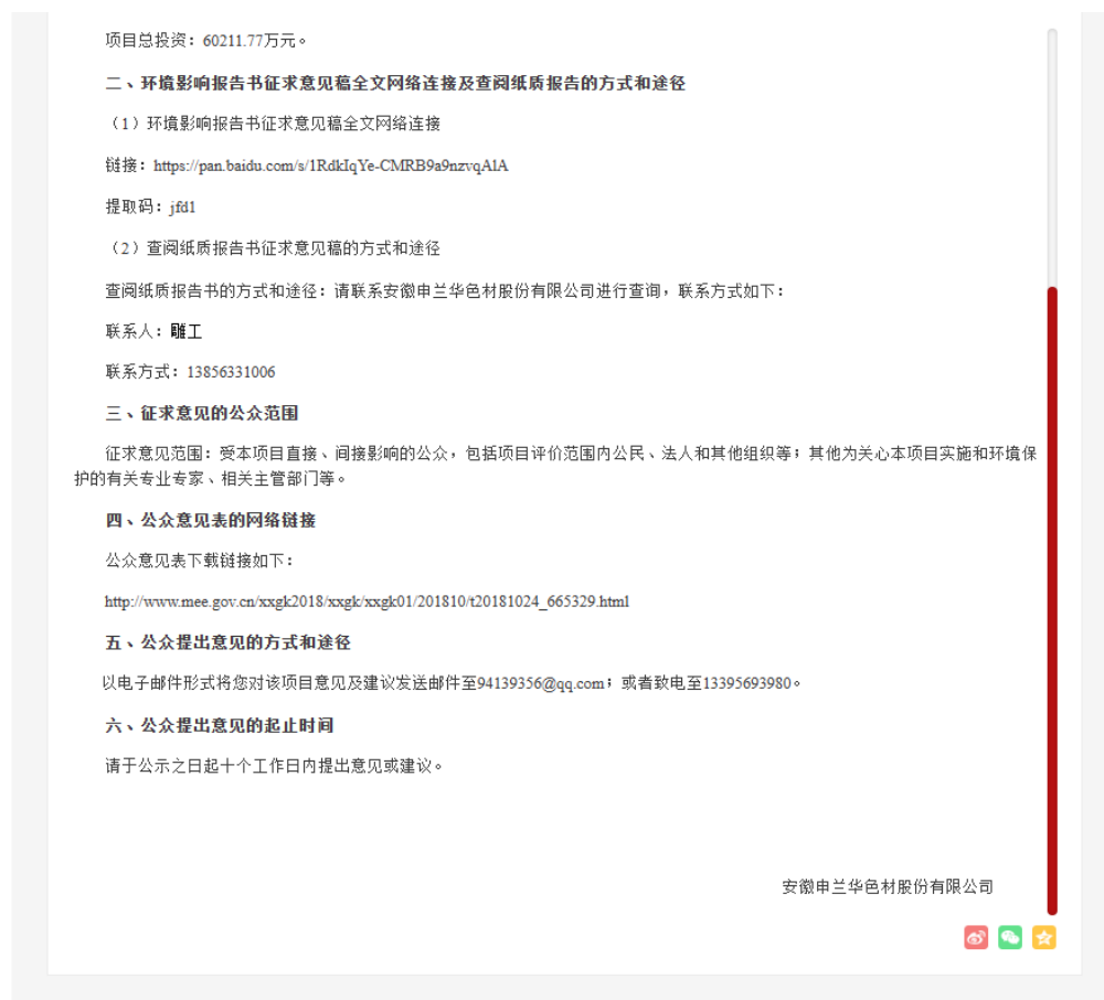
图 3-1 环境影响评价公众参与征求意见稿网络公示