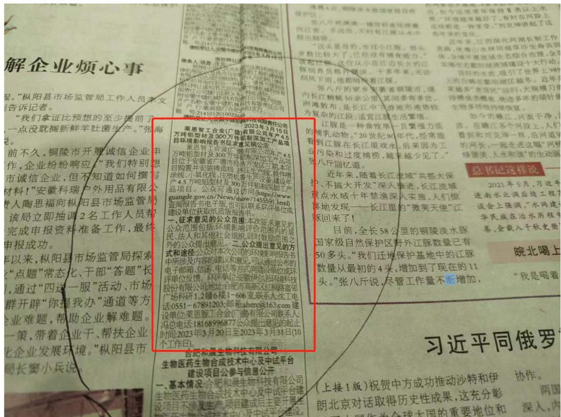
图 3-2 建设项目报纸公示截图