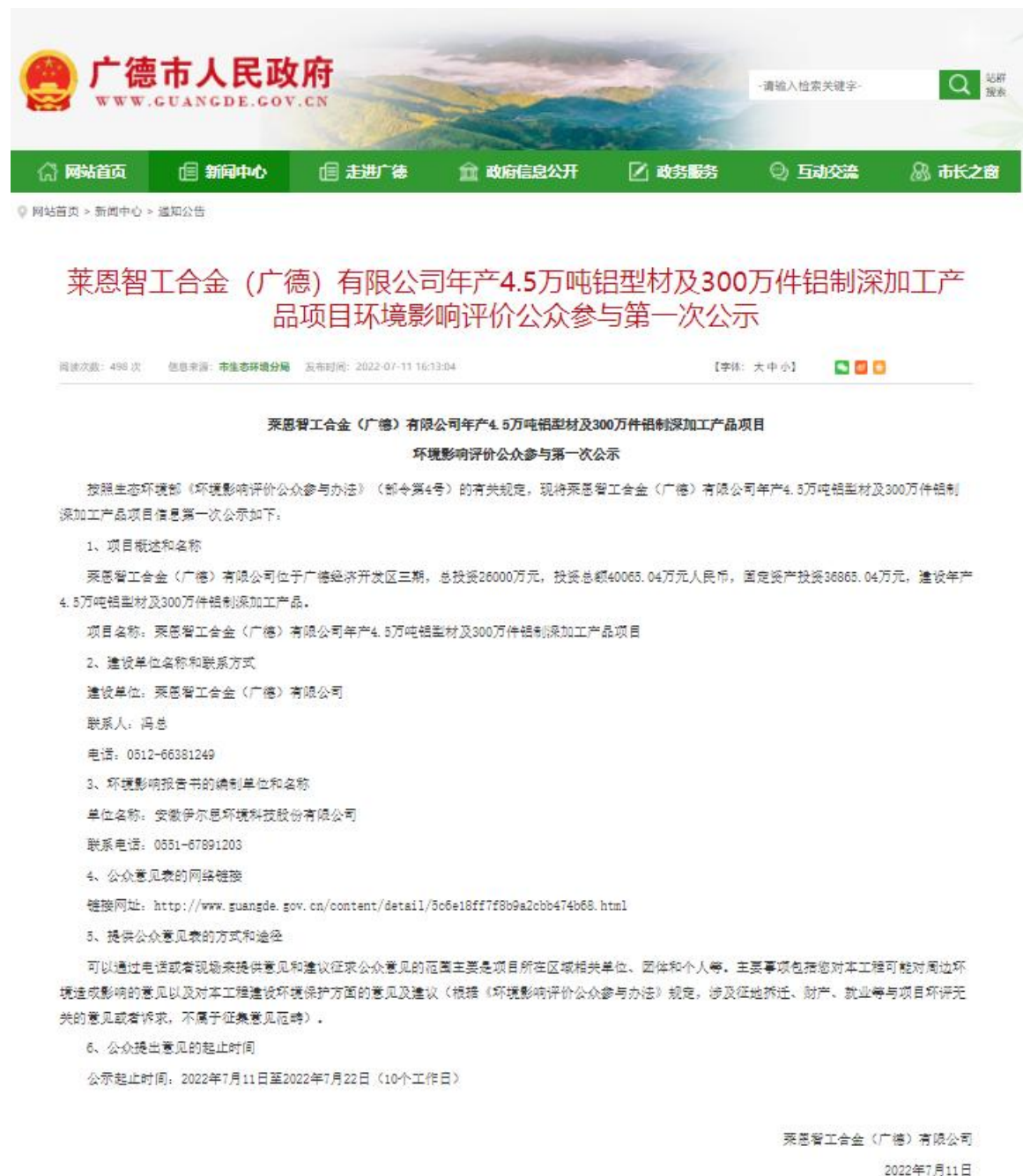
图 2-1 建设首次网络公示截图