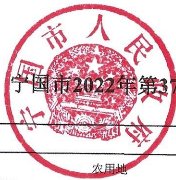
宁国市2022年第37批次城镇建设用地情况一览表