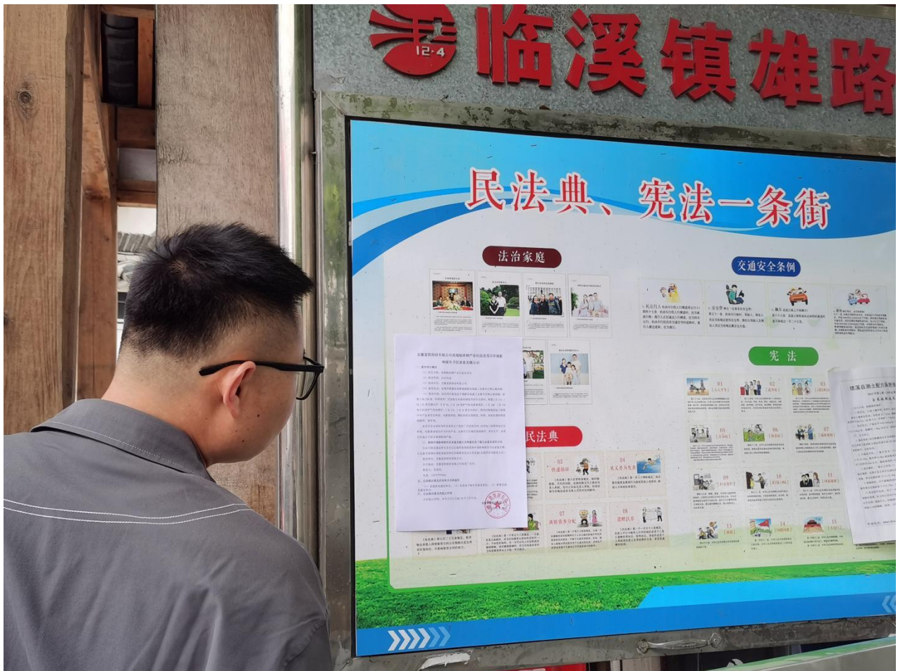
图 3-2-4 环境影响评价公众参与征求意见稿现场公告张贴