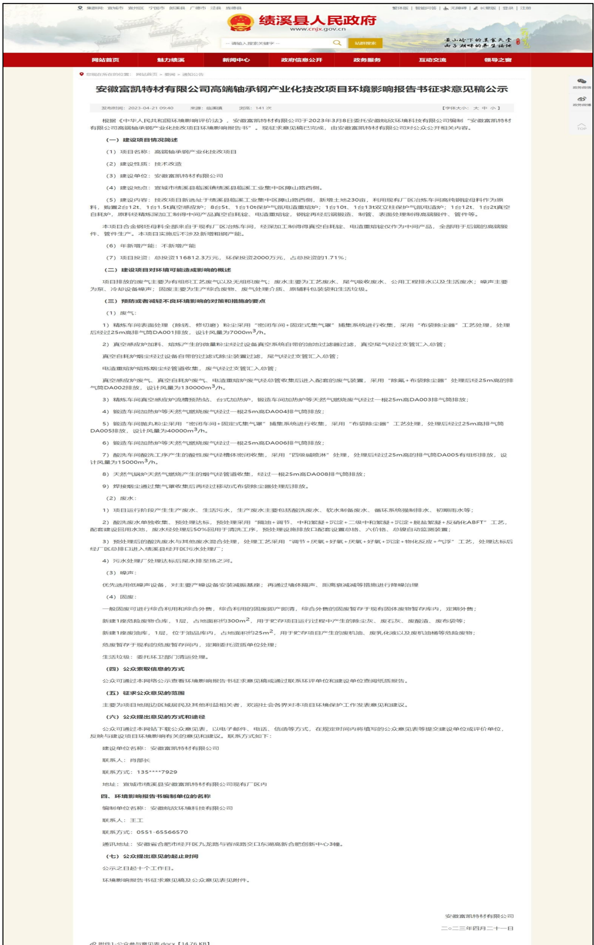
图 3-2-1 环境影响评价公众参与征求意见稿信息网络公开截图