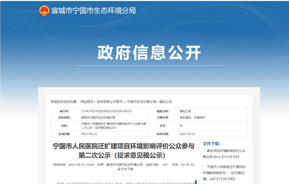
图 3.1-1 第二次网上信息公示截图

征求意见稿全文可登录宁国市生态环境分局网站（ https://www.ningguo.gov.cn/OpennessContent/show/2701883.html ）环评公示页下载。第二次网上公示截图见下图。第二次公示内容见附件2。