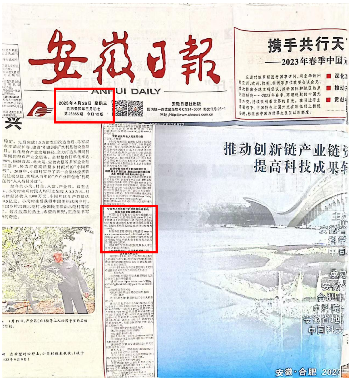
图 3.2-1 建设项目第一次报纸公开截图