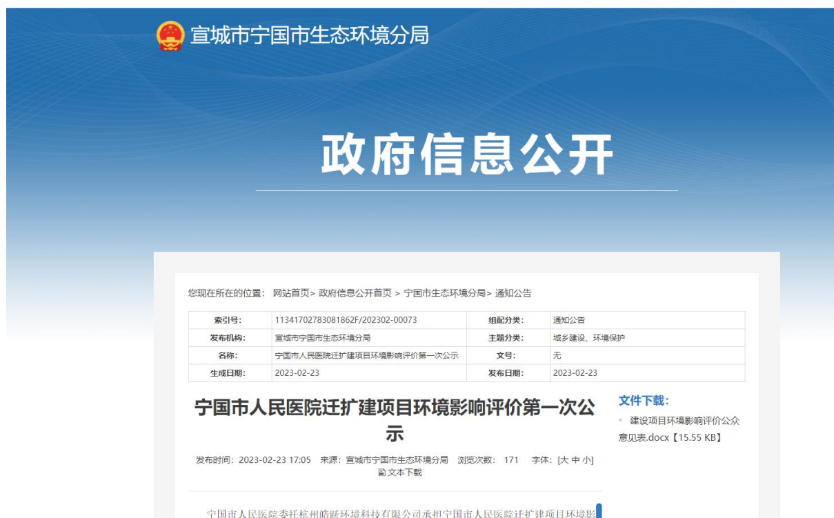
图 2.2-1 第一次网上信息公示截图

网络公开的载体选择了易于项目周边公众了解到的“宁国市生态环境分局网站”（ https://www.ningguo.gov.cn/OpennessContent/show/2660428.html ）进行了网络公示。公示日期：2023年2月23日，第一次网上公示截图见下图。第一次公示内容见附件1。