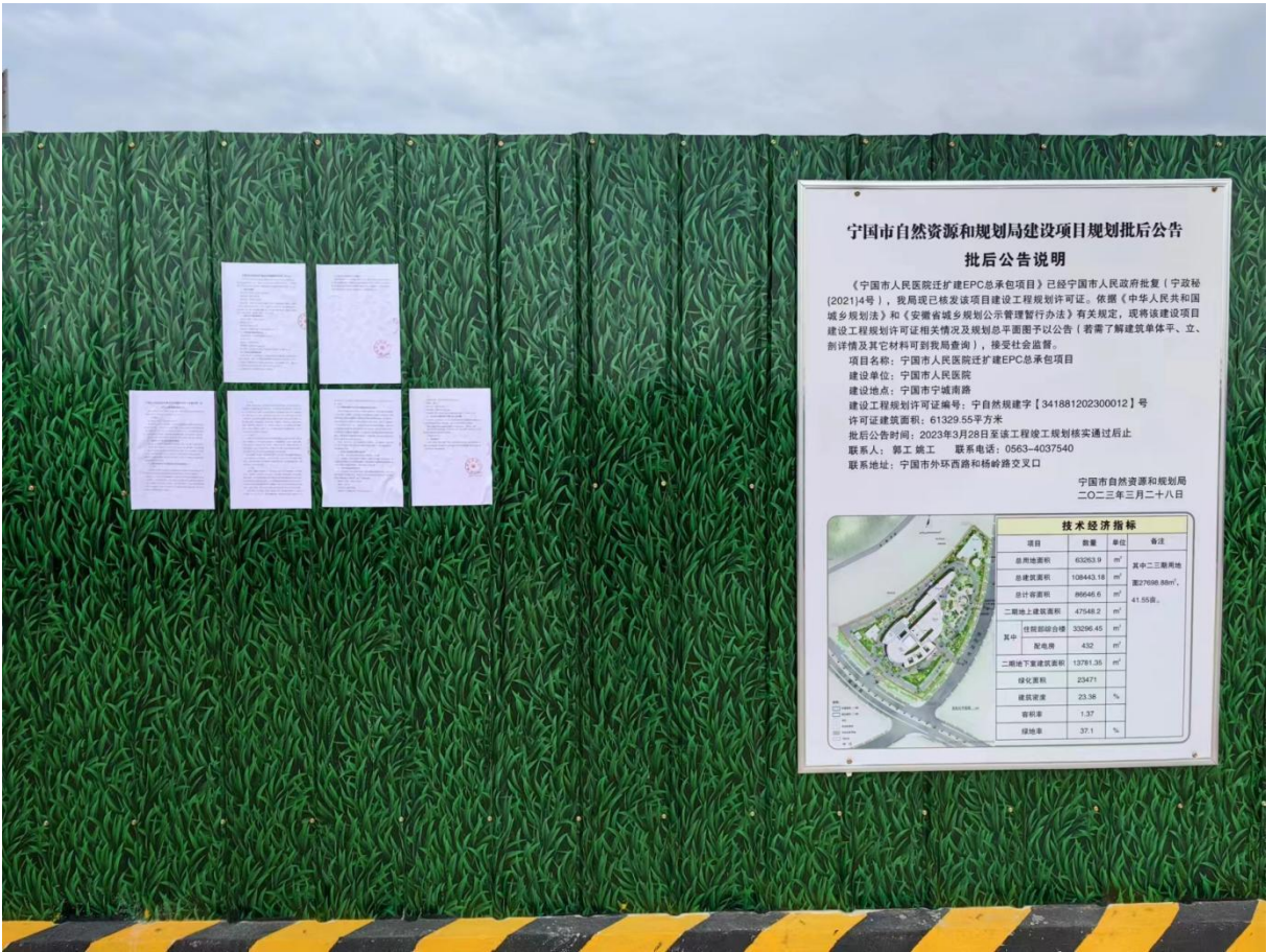
图 3.2-3 宁国市人民医院施工公开栏张贴公示照片