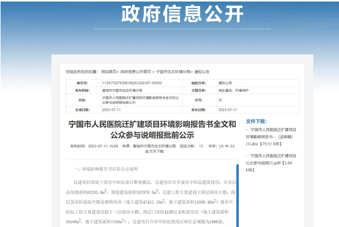
图 7.2-1 建设项目报批前公示

公示网址为 https://www.ningguo.gov.cn/OpennessContent/show/2772081.html ，以下为公示截图。