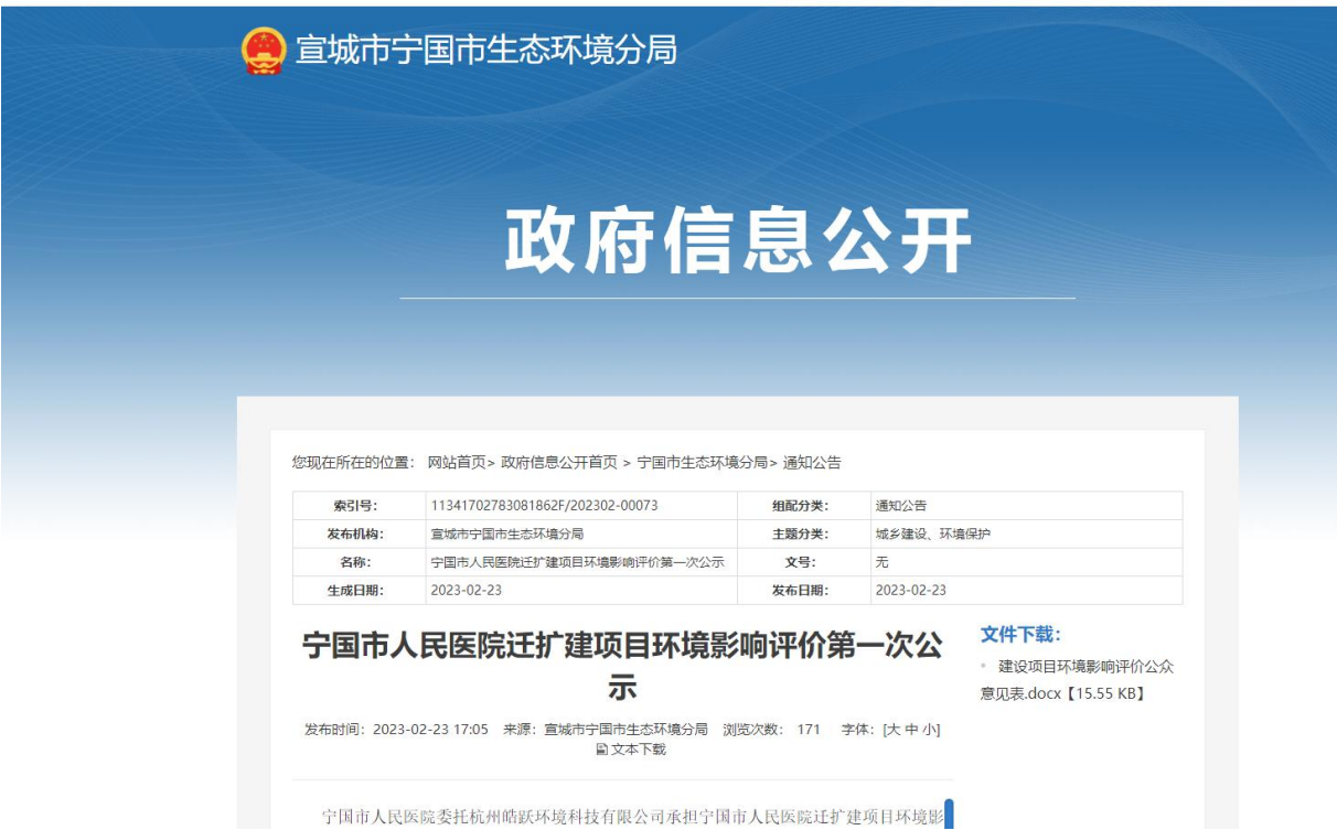
图 2.2-1 第一次网上信息公示截图

网络公开的载体选择了易于项目周边公众了解到的“宁国市生态环境分局网站”（ https://www.ningguo.gov.cn/OpennessContent/show/2660428.html ）进行了网络公示。公示日期：2023 年 2 月 23 日，第一次网上公示截图见下图。第一次公示内容见附件 1。