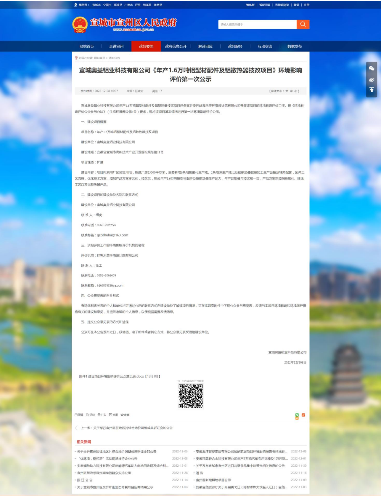
图 2-1 宣城市宣州区人民政府网站第一次公示截图