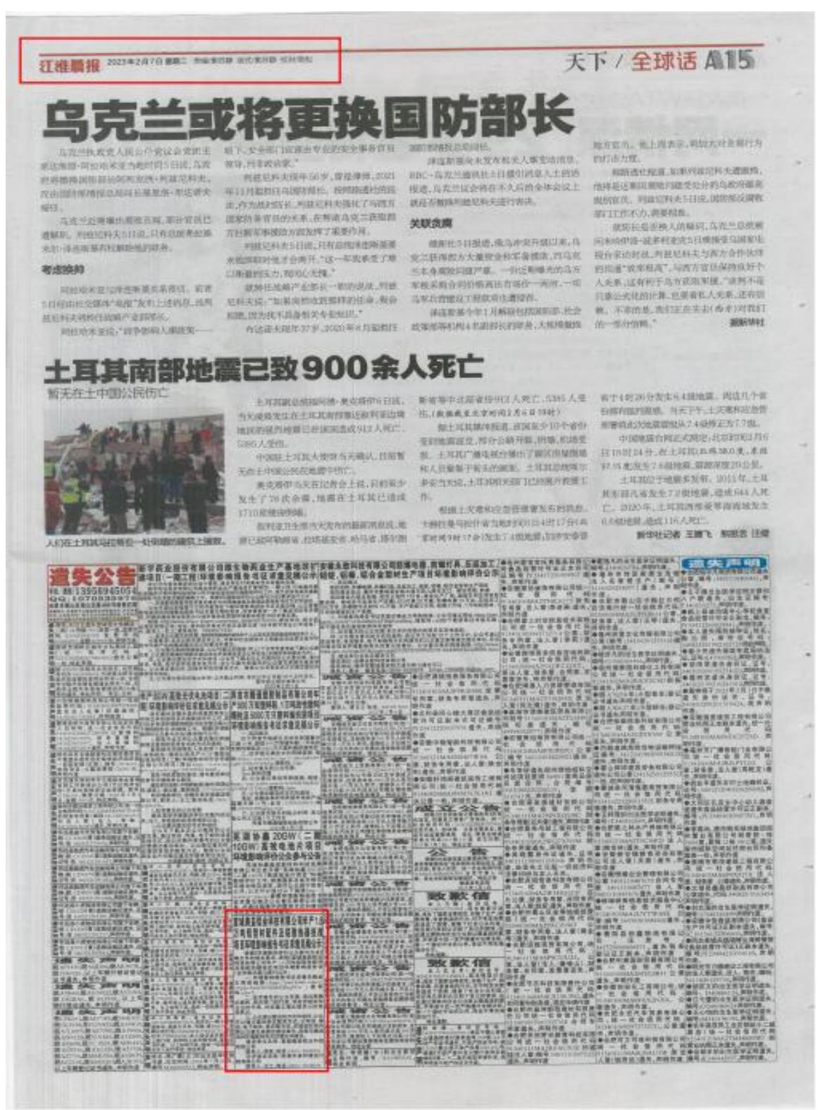
图 3-2 第一次登报公示内容

2023 年 2 月 7 日和 8 日，宣城奥益铝业科技有限公司在江淮晨报中对《年产 1.6 万吨铝型材配件及铝散热器技改项目环境影响报告书（征求意见稿）》全本公示进行登报公示。