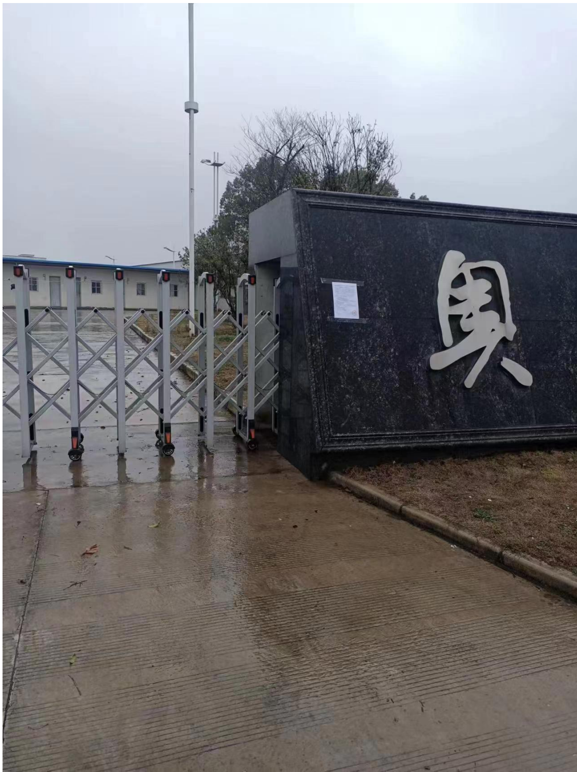
图 3-7 厂区门口全本公示现场公告情况