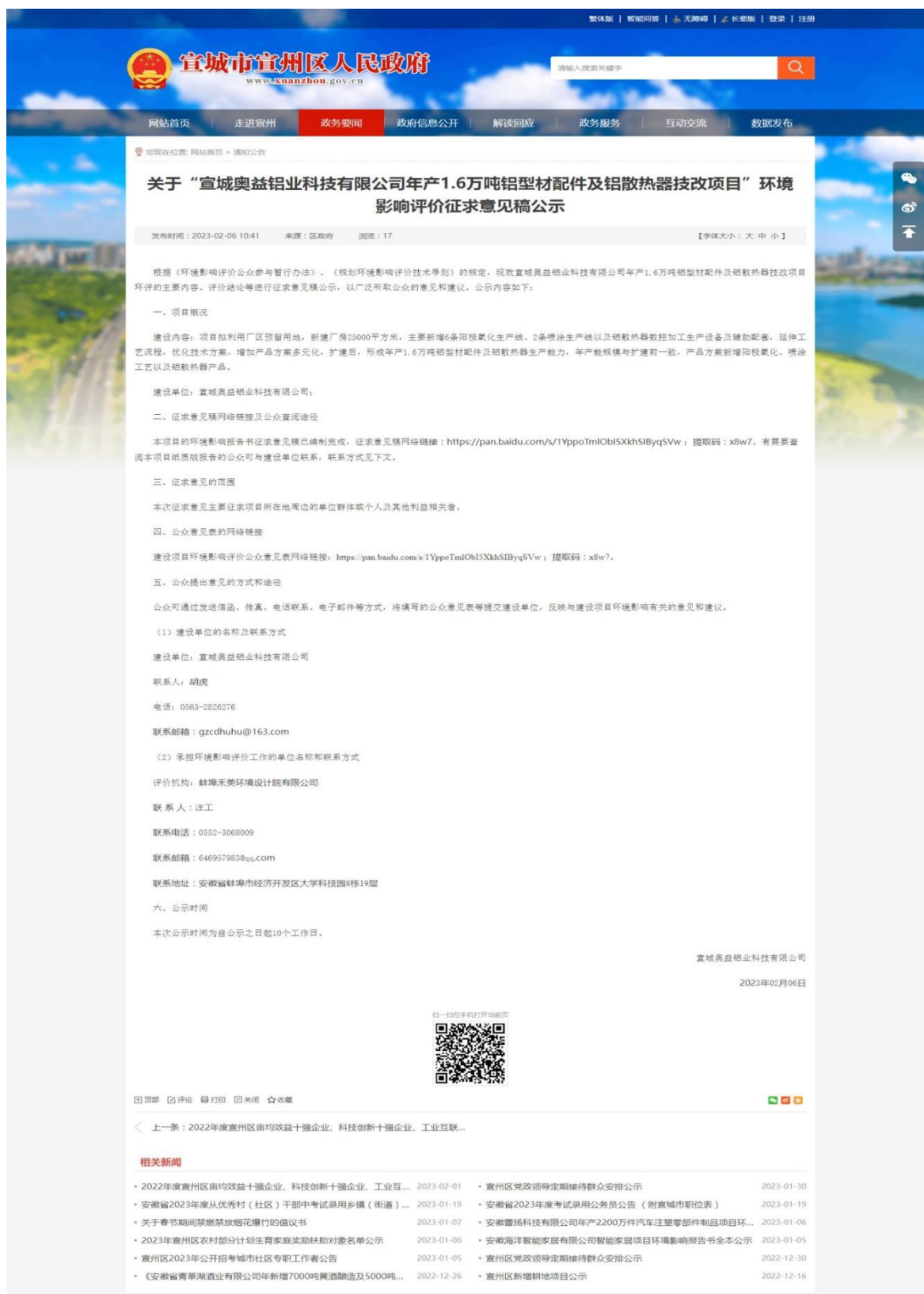
图 3-1 宣城市宣州区人民政府网站征求意见稿全本公示截图