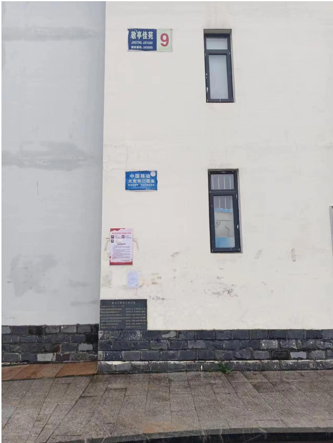
续图 3-6 巷口桥村全本公示现场公告情况