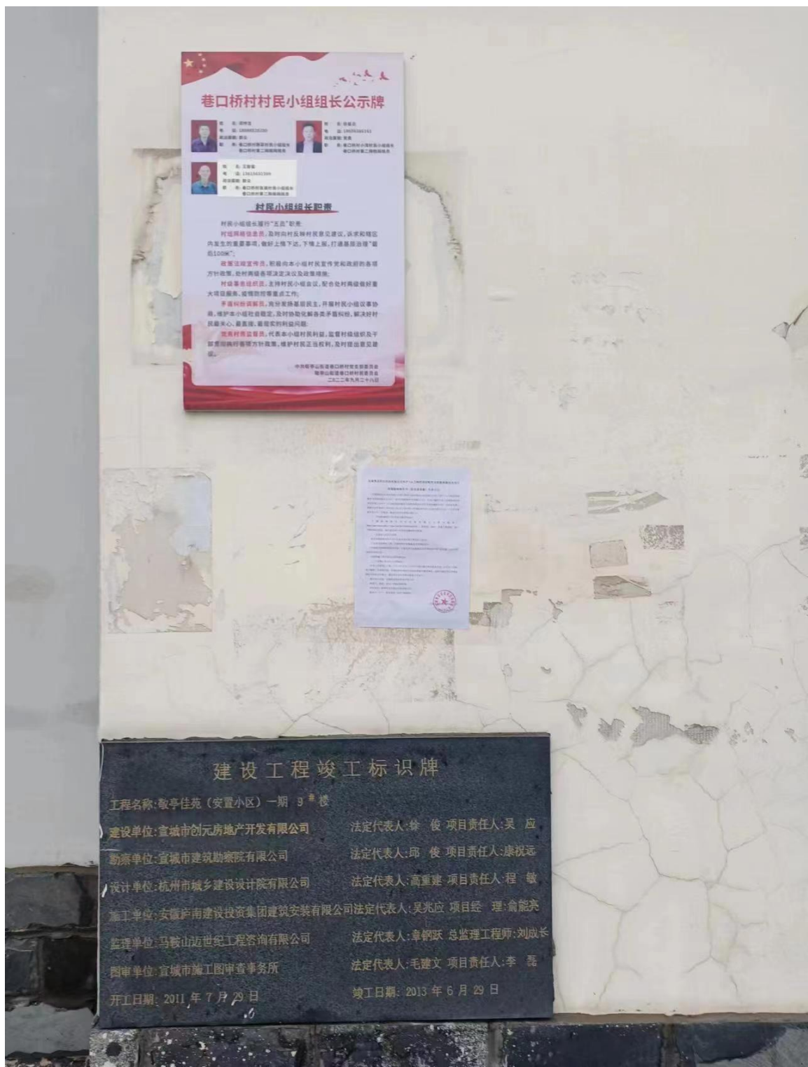
图 3-5 巷口桥村全本公示现场公告情况