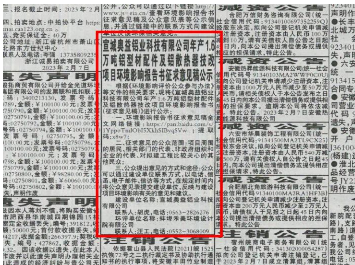
续图 3-3 第二次登报公示内容