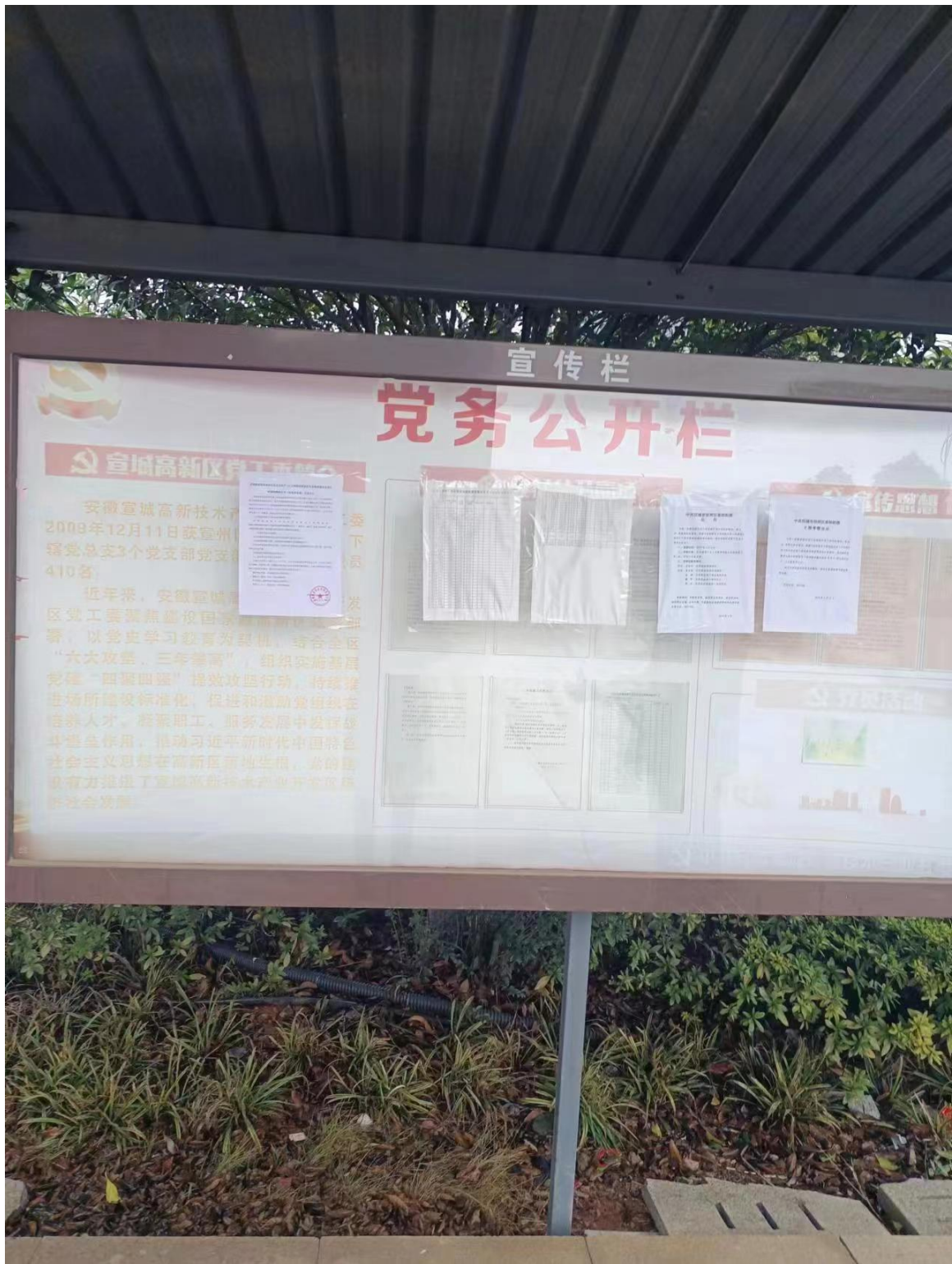
图 3-4 宣城高新区管委会全本公示现场公告情况