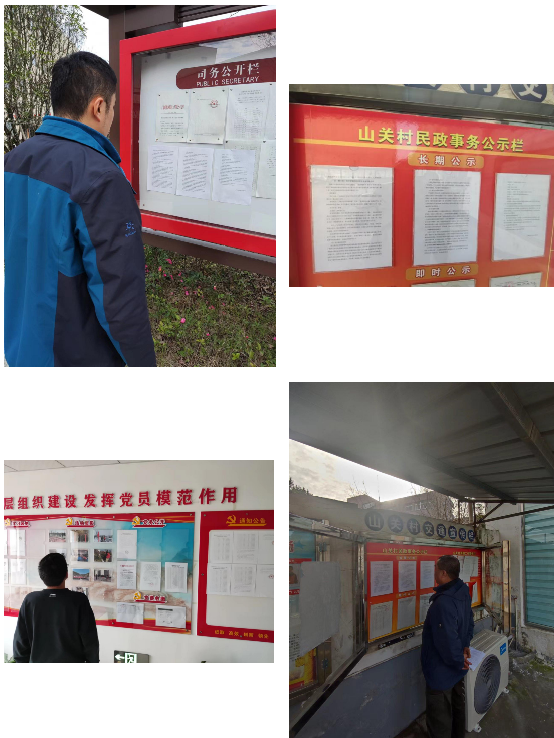
图 4 张贴公示现场照片

我单位于 2022 年 9 月 15 日在公司附近及周边张贴了公告,为项目所在地公众易于知悉的场所,符合《环境影响评价公众参与办法》的相关要求。张贴公告现场照片见下图。