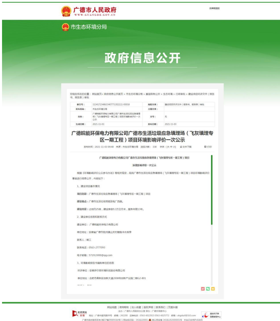
图 1 第一次公示网站截图