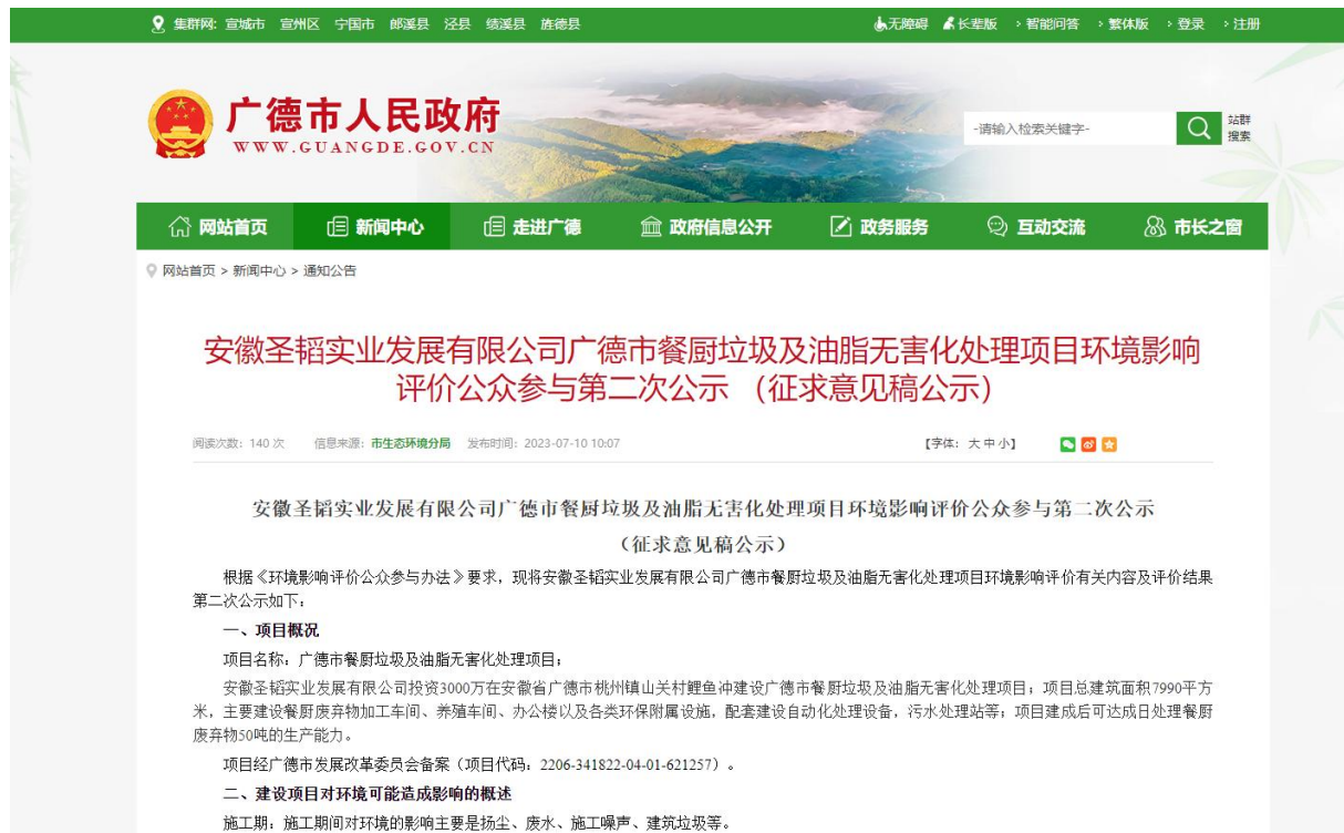
图 3.1-1 第二次网上信息公示截图

征求意见稿全文可登录广德市生态环境分局网站（ https://www.guangde.gov.cn/News/show/1482770.html ）环评公示页下载。第二次网上公示截图见下图。