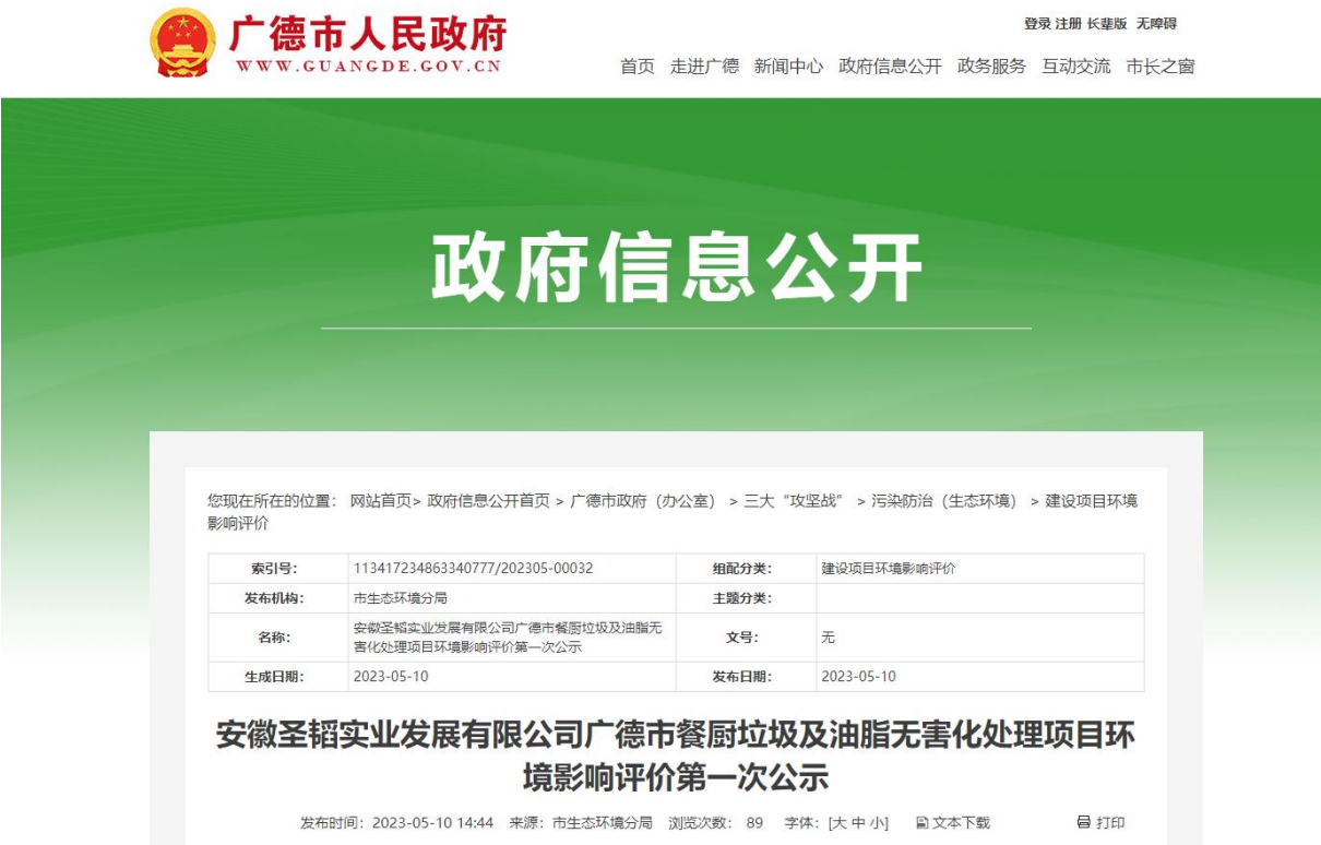
图 2.2-1 第一次网上信息公示截图

网络公开的载体选择了易于项目周边公众了解到的“广德市生态环境分局网站”（ https://www.guangde.gov.cn/OpennessContent/show/2725304.html ）进行了网络公示。公示日期：2023 年 5 月 10 日，第一次网上公示截图见下图。