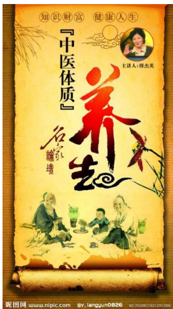
中医体质辨识 中医体质辨识的使用者需要

中医体质辨识同时还为中医标准化探索提供了一个良好范例。中医体质辨识操作简单、方便理解、容易为使用者所接受，有助于中医药理论体系走近现代人生活，有助于中医药理论体系走出国门。 [1]