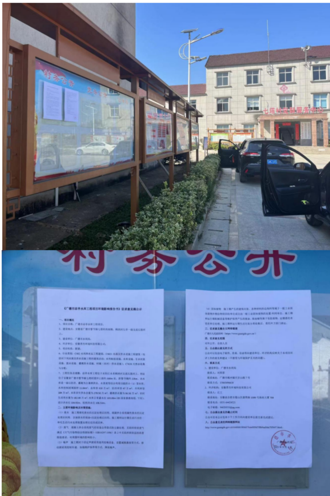
图5.2 (2) 环境影响评价公众参与征求意见稿公告张贴（七塔村）