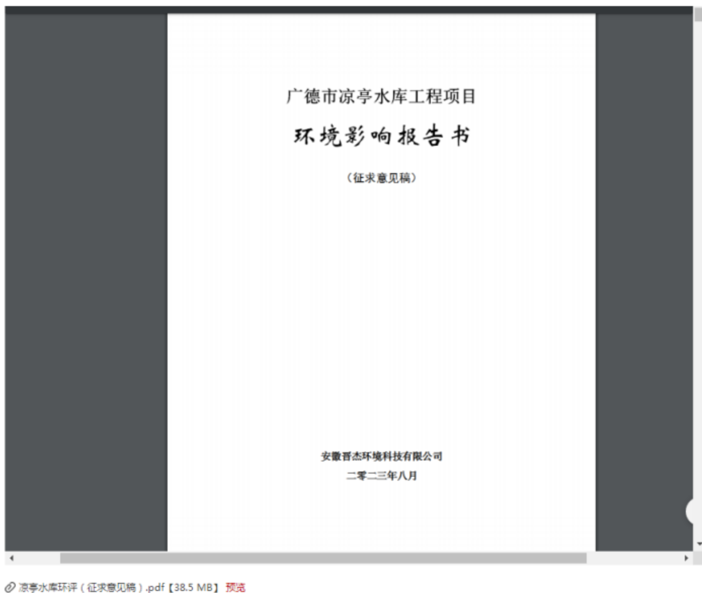
图 3.2 环境影响评价公众参与征求意见稿网络公示