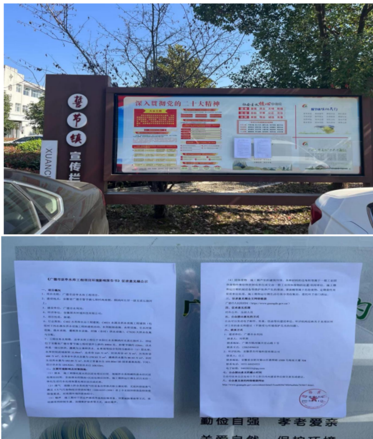
图 5.1 (1) 环境影响评价公众参与征求意见稿公告张贴（誓节镇）

根据《办法》第十一条第三款，需通过在建设项目所在地公众易于知悉的场所张贴公告的方式公开，本次公开选择在当地村委会、乡镇及项目现场张贴公告，社区居民等均是建设项目所在地公众易于知悉的场所，符合《办法》要求。张贴时间为 2023 年 9 月 4 日。具体公示情况如图 5.1 所示。