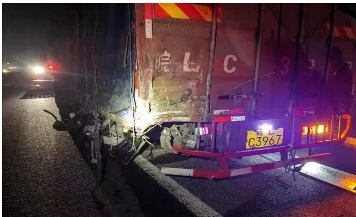
图 3 事故货车事故后现场图

事故发生时皖 B62021 号小型普通客车驾驶员刘*华系安全带，在事故中受伤；孙*玲坐副驾驶，系安全带，在事故中当场死亡；张*富坐第二排左侧位置，未系安全带，在事故中受伤；何*坐第二排右侧位置，未系安全带，在事故中当场死亡；卜*意坐后排最左侧，未系安全带，在事故中受伤；严*英坐最后排中间，未系安全带，在事故中受伤后抢救无效死亡；开*海坐最后排右侧，未系安全带，在事故中受伤后经抢救无效死亡。