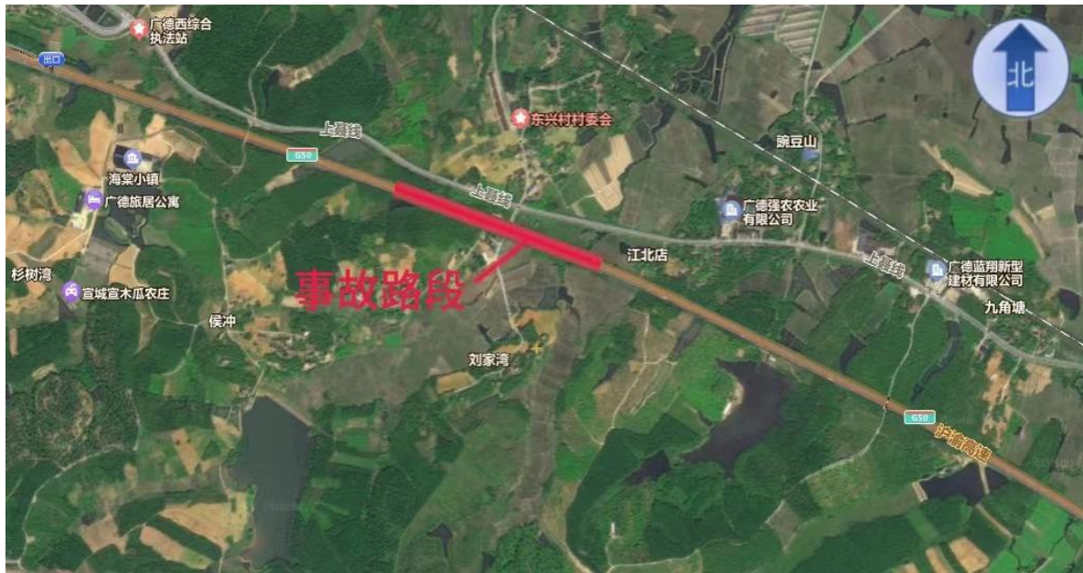
图 1 事故路段地理位置图

1997 年 9 月竣工，2023 年 3 月 G50 改扩建工程开始施工建设，事故发生时正处于施工阶段。