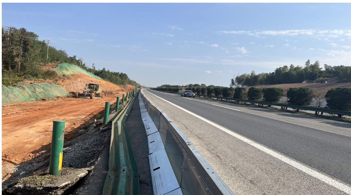
图 2 GX-03 标段高速公路图

交通组织方案》《新老路搭接及路床施工专项工作会议纪要》的要求，事故路段移动钢护栏位于硬路肩外侧边缘，非行车道内侧或外侧，与《应急车道封闭方案》要求不符，但是事故路段施工现场移动钢护栏设置问题与本起事故无因果关系，不是导致事故发生的原因。