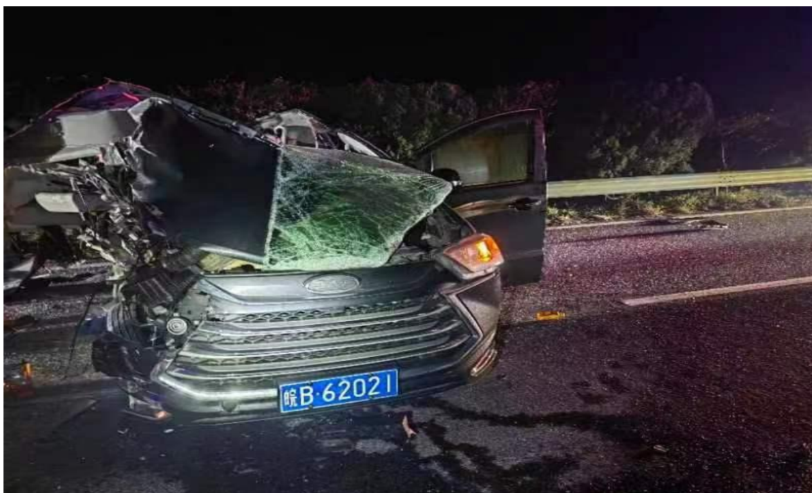
图 4 事故小汽车事故后现场图