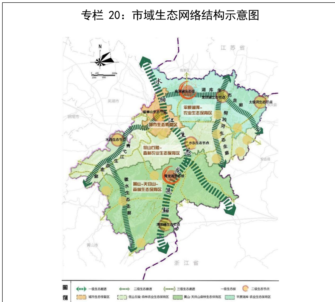
专栏 20：市域生态网络结构示意图

2. 大力推动生态保护修复。 推动山水林田湖草系统治理，争取国家山水林田湖草生态保护修复试点。强化长三角绿色生态屏障保护修复，聚焦重点生态功能区、重点生态敏感区，提升生态系统服务功能。实施宣城南部山区水土流失重点区、露天矿山开采区和北部圩区河湖湿地生态修复，强化水源涵养、水土保持等生态功能。推进扬子鳄自然保护区片区生态修复，建立栖息地生态保护红线区项目准入制度。推深做实“林长制”改革，争创全国林长制改革示范区。实施强基护绿、提质增绿、高效管绿、全