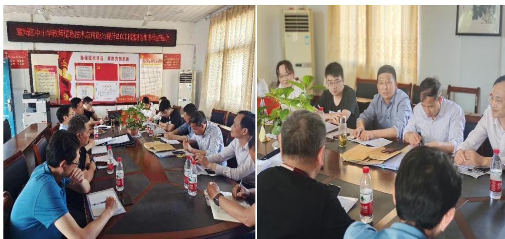
——监测工作组在沈村中心小学