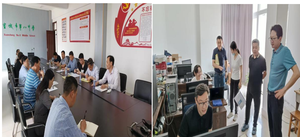
——监测工作组在市八中