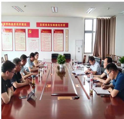
——监测工作组在市二中