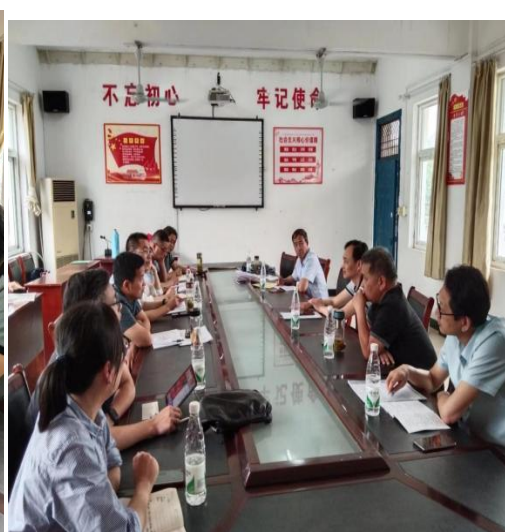
——监测工作组在卫东学校