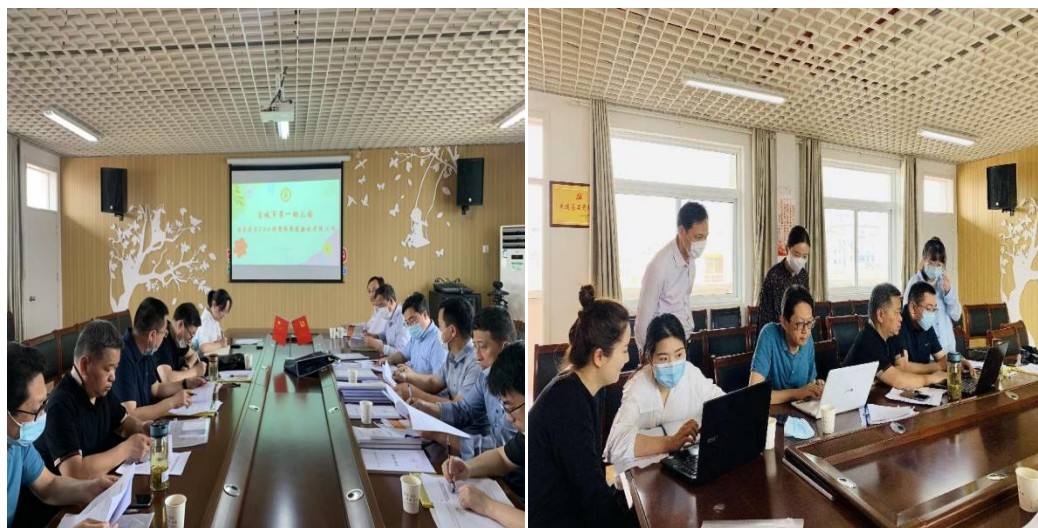
——监测工作组在市一幼