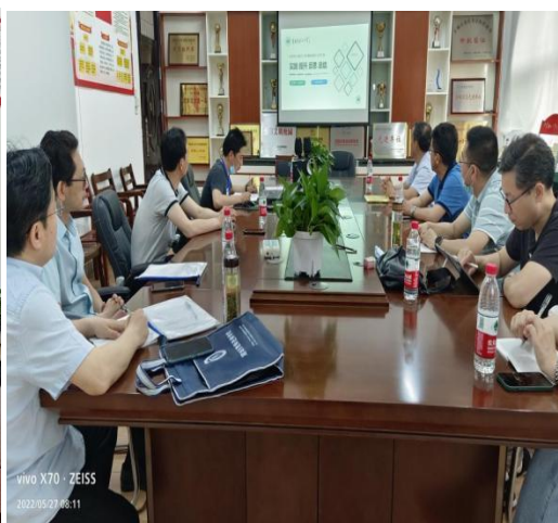
——监测工作组在市二小